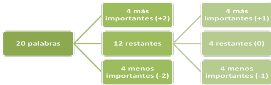
Figura 1. Elección sucesiva por bloques.