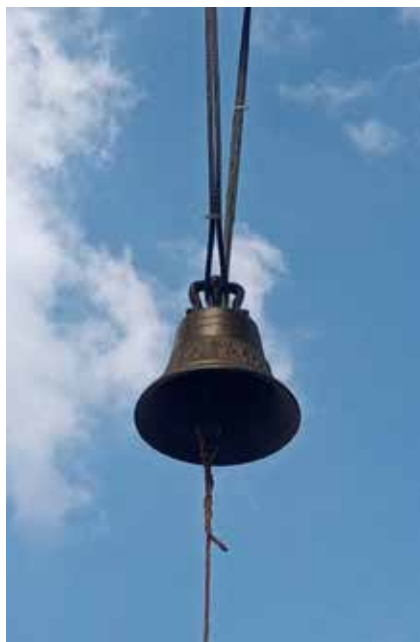
Figura 5: Campana de la vida en el Instituto Nacional de Enfermedades Respiratorias.

tarios en la prensa 16 y ha gozado de gran aceptación del personal. 17