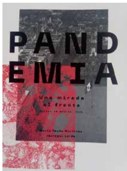
Figura 3: Editorial: Offset Santiago, S.A. de C.V. Páginas: 227. ISBN 978-607-98514-3-9