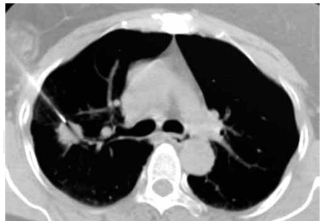
Figura 1: TC de tórax. BPTT con aguja de Chiba en lesión pulmonar derecha.

Procedimiento de toma de biopsias: Previa asepsia y antisepsia del sitio anatómico correspondiente a la lesión ubicada por TC (marca Siemens, modelo Somaton Sensation 16) simple y contrastada, se colocó al paciente en decúbito, en la posición más accesible, se administraron 8 ml de lidocaína simple al 2%, se introdujo la aguja de Chiba calibre 22 y longitud 15 cm. Se instiló 0.5 ml de solución fisiológica, aspirando en 3 ocasiones el contenido de la lesión pulmonar (figura 1), cambiando discretamente su angulación. Se vació el contenido de la aspiración en 4 laminillas estériles, se realizó el extendido colocándolo en frasco estéril con 150 ml de alcohol al 70%. Acto seguido se realizó la biopsia con aguja de Tru-cut en