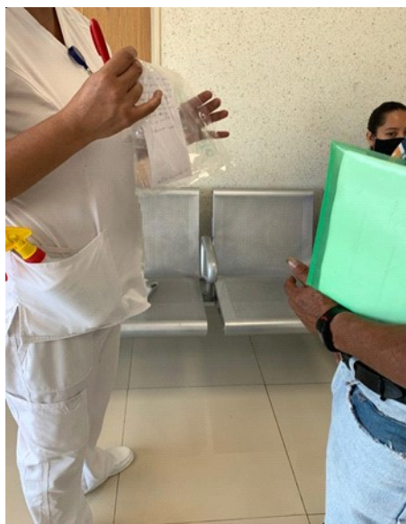
Figura 2. Protocolo de despedida por carta.

6. Se notificará por escrito y luego telefónicamente a la fami-