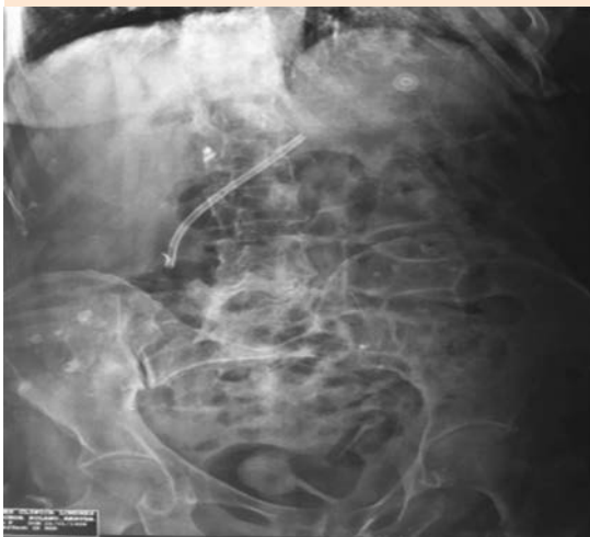
Figura 2. Radiografía de abdomen.

La paciente egresó por mejoría el 1 de enero de 2015. El 17 de marzo de 2015 fue llevada a Urgencias por deterioro del estado de alerta,