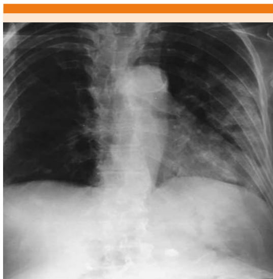
Figura 1. Telerradiografía de tórax de la paciente con consolidación en la base izquierda.

La paciente tuvo respuesta favorable a tratamiento con fluidoterapia, soporte respiratorio no invasivo, apoyo vasopresor, meropenem y vancomicina, con egreso hospitalario el 1 de noviembre de 2014. Fue llevada a Urgencias una semana posterior a su egreso por dolor abdominal y evacuaciones disminuidas en consistencia, en número de 10 ocasiones en 24 horas y temperatura axilar de 38.4°C de 48 horas de evolución. Los estudios paraclínicos de ingreso evidenciaron: Hg 10.5 g/dL, HCTO 32.5%, VCM 88 fl, HCM 28 pg, plaquetas 558,000 \mu L, leucocitos 14,600 \mu L, neutrófilos 83%, bandas 3%, linfocitos 5%. Ingresó al servicio de Medicina Interna con reporte de toxinas A/B de Clostridium difficile en heces positivas, por lo que se diagnosticó colitis pseudomembranosa secundaria a antibióticos y se inició tratamiento con metronidazol IV/VO, con adecuada respuesta clínica, por lo que egresó el 10 de noviembre de 2014. Acudió a Urgencias el 24 de noviembre