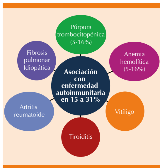
Figura 5. Relación con enfermedades autoinmunitarias.