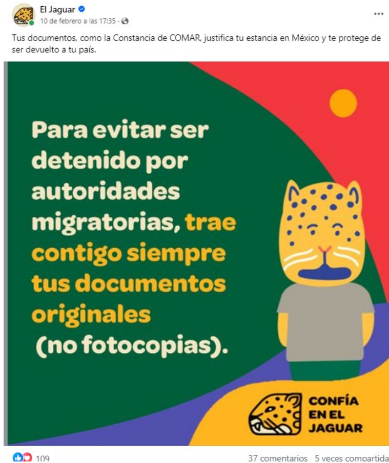
Figura 3. Post con el alter ego de EJ