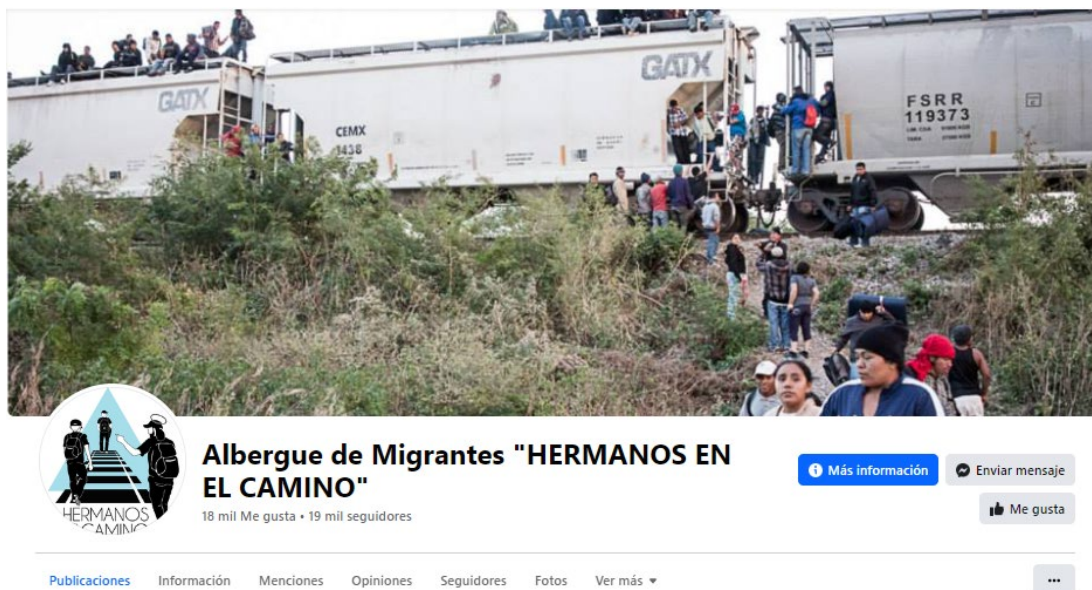
Figura 4. Perfil de Hermanos en el camino

HM y HC también son ONG orientadas a la resolución de problemas, como se aprecia en los verbos que emplean, sobre acciones materiales o que suponen ayuda, pero su ethos no es tan evidentemente institucional; además, tanto una como otra no abogan por disuadir del objetivo de seguir avanzando hasta EE. UU. El nombre mismo de HC, implícitamente, conlleva asumir un desplazamiento, y que este no es exclusivo de migrantes (figura 4).