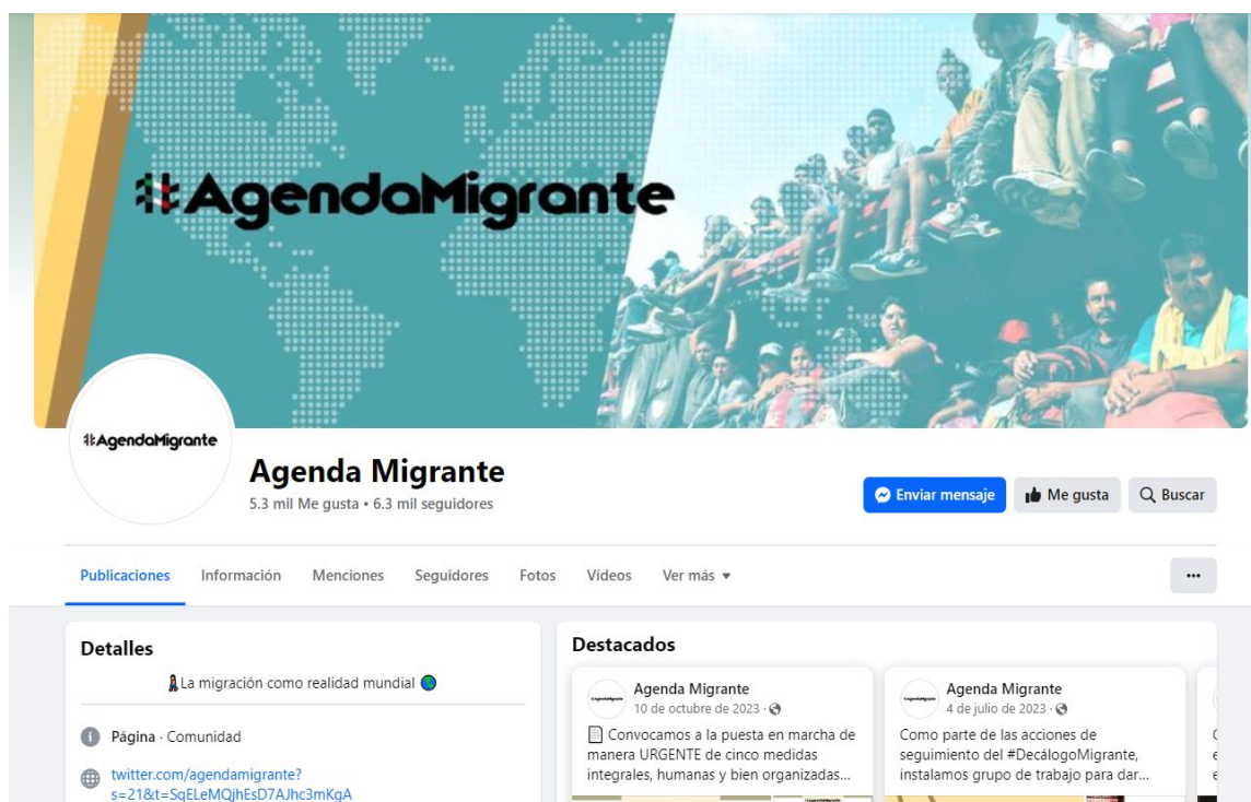
Figura 1. Perfil de AM