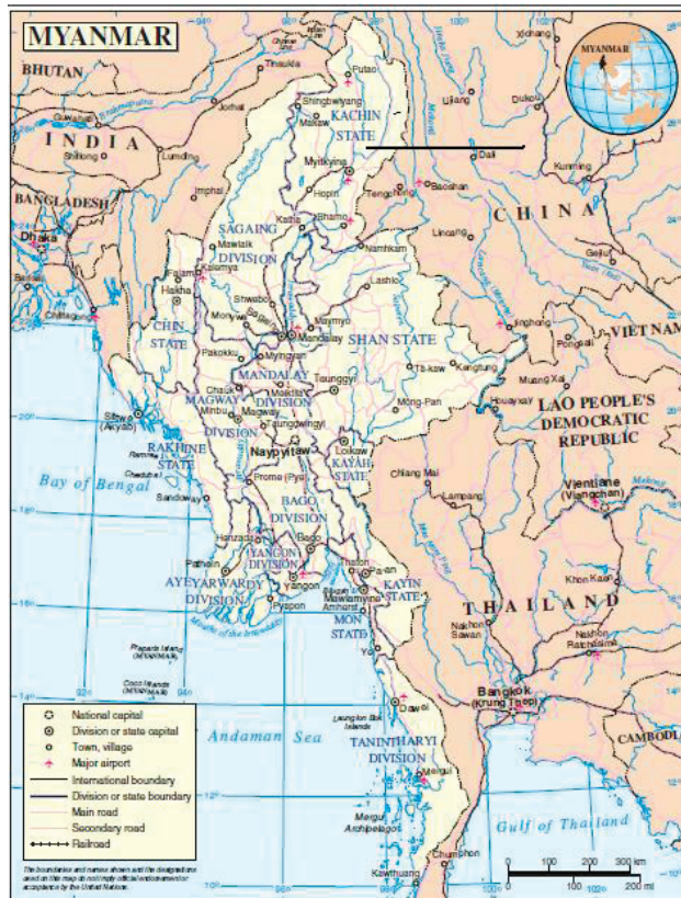
Figura 1 División política de Myanmar