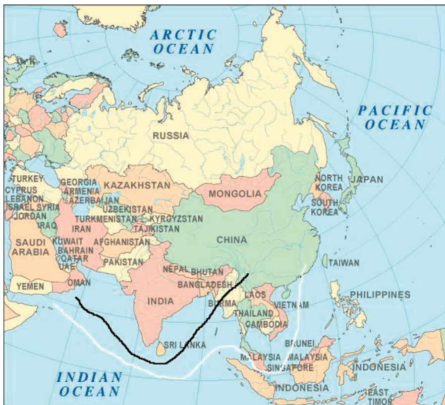
Figura 2 Nueva ruta de suministro energético