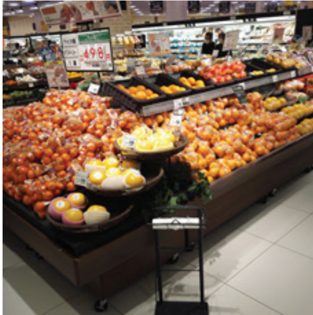
Figura 1 Cítricos en un supermercado japonés

Cítricos en “AEON Mall Makuhari-shintoshin”, 02/05/2016.