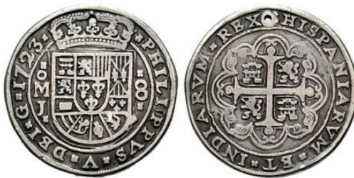
Figura 2 Ocho reales redondo o galano de 1723 de la ceca de México