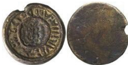
Figura 4 Barrilla de Manila de 1728