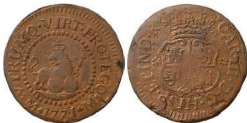
Figura 5 Barrilla de 1766