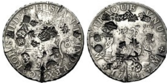
Figura 1 Ocho reales columnarios de la ceca de México de 1764 con múltiples resellos chinos