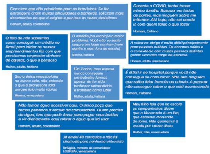
Figura II – Relatos dos refugiados participantes do Relatório Diagnósticos Participativos 2023

Fonte: Adaptado pelos autores a partir do ACNUR (2023: 7-14; 17).