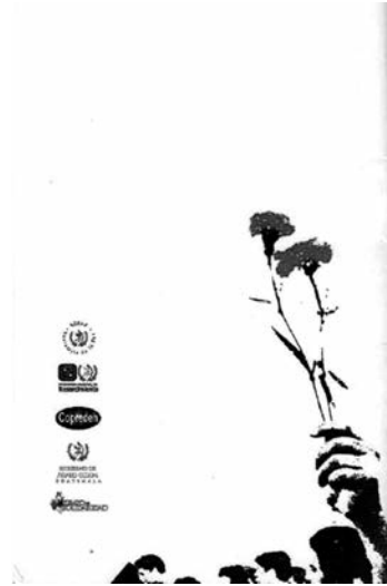
9. La marcha de los claveles rojos, 2009, portada y contraportada.