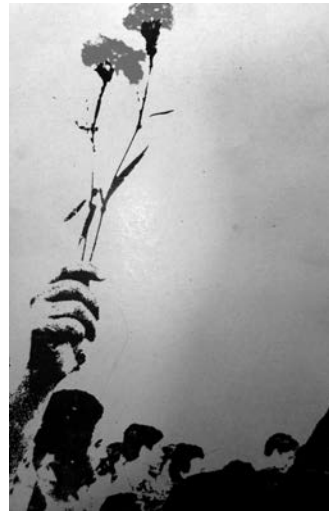
7. Jornadas de agosto de 1977, 2007, portada y contraportada.