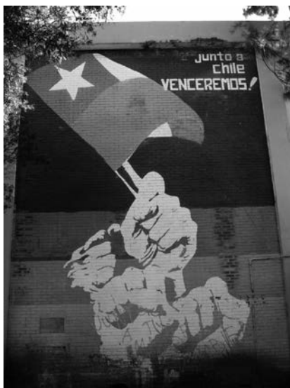
5. Grupo Tábano, Junto a Chile venceremos, Edificio C de la Ciudad Universitaria, Facultad de Arquitectura, 1978. Fotografía: jcv, enero de 2007.