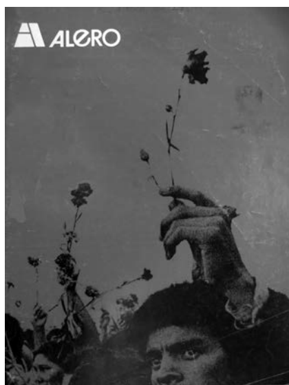
2. Revista Alero, portada, 1977.