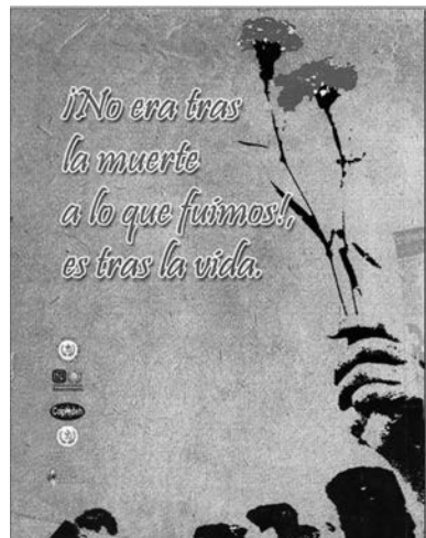
8. Jornadas de Agosto de 1977, 2009, portada y contraportada.