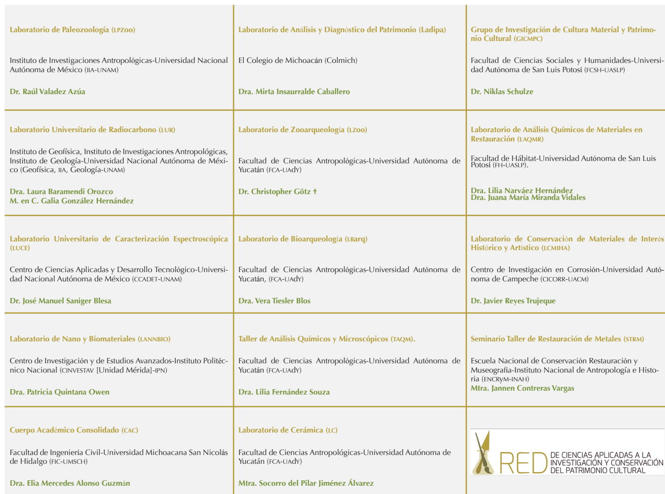
FIGURA 5. Laboratorios, grupos de investigación e instituciones participantes en la Red de Ciencias Aplicadas a la Investigación y la Conservación del Patrimonio Cultural (Red-CAICPC) (Cortesía: Red-CAICPC).

rollo nacional, incrementar el impacto regional de los grupos de investigación mediante acciones de colaboración estratégica que implican, por ejemplo, la utilización compartida de equipos, el intercambio de experiencias y la formación especializada. En efecto, uno de sus aportes más significativos ha sido fortalecer los vínculos habidos entre los laboratorios y diversos grupos de investigación, así como ocasionar la creación de diferentes plataformas de colaboración, con lo que se han formulado y compartido protocolos comunes, detectado otros espacios de oportunidad y líneas de trabajo, e identificado más grupos de investigación que gradualmente se integrarán a las iniciativas de la red.