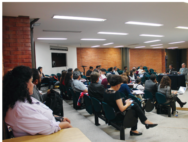
FIGURA 6. Reunión Nacional de la Red-CAICPC en la Escuela Nacional de Conservación, Restauración y Museografía (ENCRyM), del INAH, en noviembre del 2015.

Es indudable que en un relativo corto periodo de tiempo, las diversas estrategias emprendidas por la Red-CAICPC, aparte de que han acelerado la reticulación, la articulación y el crecimiento propios, han optimizado y poten-