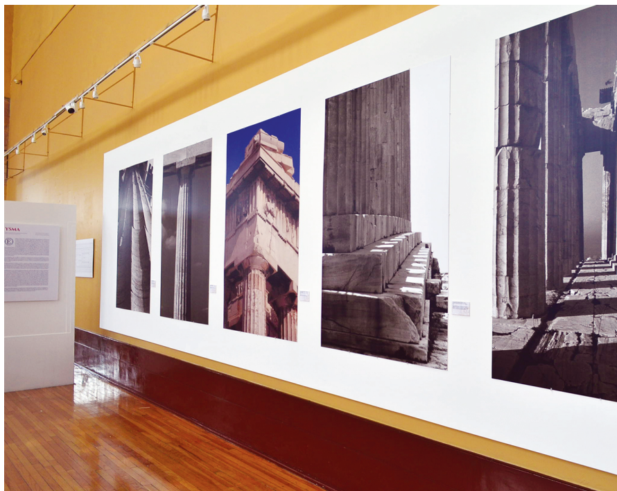
FIGURA 4. Exposición Partenón: arquitectura y arte , muro norte, MNA-INBA, México.