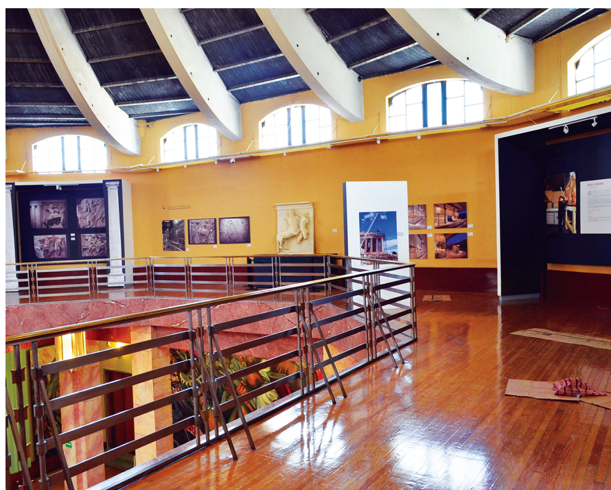
FIGURA 5. Exposición Partenón: arquitectura y arte , muro este; al centro, reproducción del dintel que representa la guerra de los centauros, MNA-INBA, México (Fotografía: Josué Flores, 2013; cortesía: fototeca MNA-INBA, DACPAI-INBA).

la arquitectura. De acuerdo con las directrices tecnológicas actuales, el museo también dispone de un recorrido virtual por las instalaciones y se mantiene en comunicación constante con el público por medio de la red social Facebook .