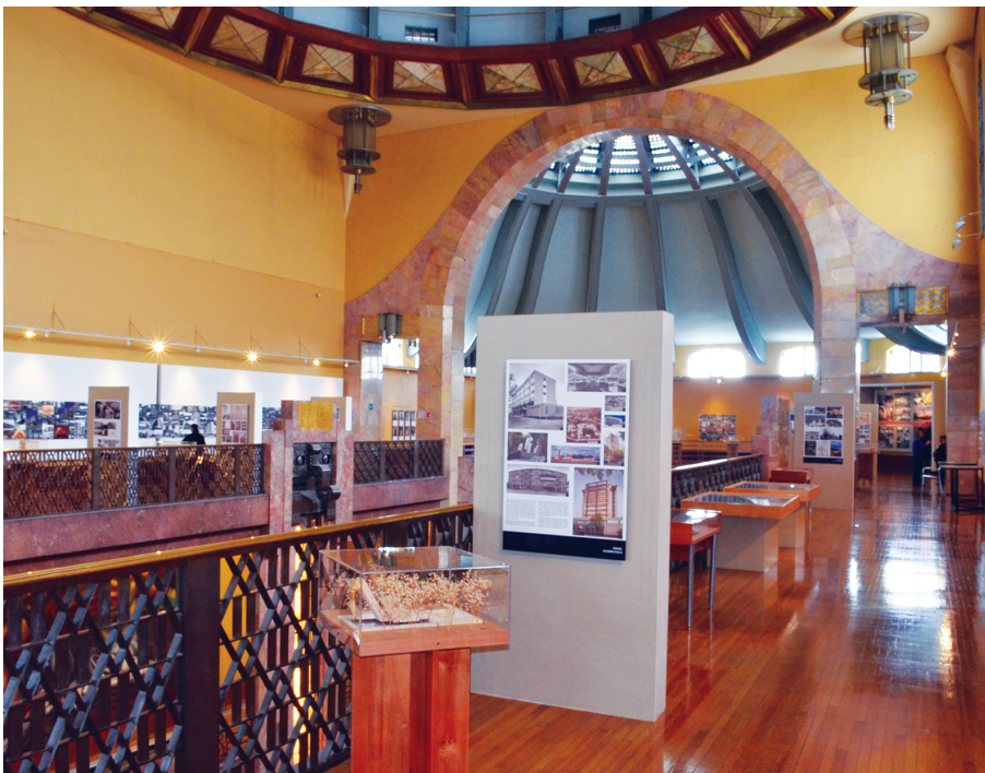
FIGURA 3. Vista general de la exposición Presencia del exilio español en la arquitectura mexicana , MNA-INBA, México.