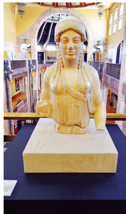
FIGURA 6. Exposición Partenón: arquitectura y arte , reproducción de una koré usada como ofrenda a la diosa Atenea, MNA-INBA, México (Fotografía: Josué Flores, 2013; cortesía: fototeca MNA-INBA, DACPAI-INBA).