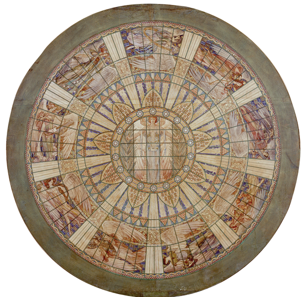
FIGURA 8. Acuarela original del plafón luminoso de cristal de la sala principal del Palacio de Bellas Artes, INBA (Dibujo: Geza Maróti, ca. 1910).

nes: hoy en día tanto el Departamento de Investigación como el equipo de museografía de este recinto afronta varios retos, entre los que está el establecer más vínculos con universidades, centros de investigación e institutos culturales con el objeto de divulgar las muestras de arquitectura que se han presentado en el museo. Por otra parte, es evidente que tiene la necesidad de lograr una mayor difusión hacia la sociedad en general, para lo que será fundamental, además de aumentar la visibilidad del MNA-INBA, cuya vocación y oferta, por encontrarse en el tercer nivel del PBA —un edificio con considerable visita tanto nacional como internacional—, suelen pasar inadvertidas, solventar las medidas precautorias de acceso (si bien necesarias para el cuidado de un inmueble declarado monumento artístico) que llegan a desalentar a sus visitantes. Asimismo, parece fundamental cambiar la idea de que, por tratarse de un museo especializado, sus contenidos están acotados a los profesionales de la arquitectura. En esta tarea resulta esencial configurar un paquete museográfico que efectivamente acerque la cultura arquitectónica a estudiantes de diferentes grados, y despierte en ellos el interés por una disciplina cuyas obras