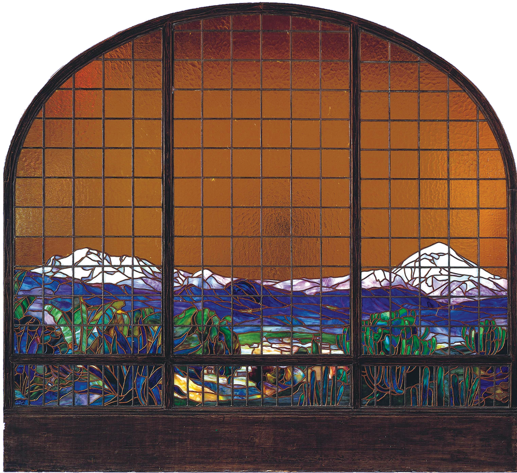
FIGURA 7. Diseño del telón de cristal de la sala principal del Palacio de Bellas Artes, INBA (Maqueta: Geza Maróti ca.1908).

nes: hoy en día tanto el Departamento de Investigación como el equipo de museografía de este recinto afronta varios retos, entre los que está el establecer más vínculos con universidades, centros de investigación e institutos culturales con el objeto de divulgar las muestras de arquitectura que se han presentado en el museo. Por otra parte, es evidente que tiene la necesidad de lograr una mayor difusión hacia la sociedad en general, para lo que será fundamental, además de aumentar la visibilidad del MNA-INBA, cuya vocación y oferta, por encontrarse en el tercer nivel del PBA —un edificio con considerable visita tanto nacional como internacional—, suelen pasar inadvertidas, solventar las medidas precautorias de acceso (si bien necesarias para el cuidado de un inmueble declarado monumento artístico) que llegan a desalentar a sus visitantes. Asimismo, parece fundamental cambiar la idea de que, por tratarse de un museo especializado, sus contenidos están acotados a los profesionales de la arquitectura. En esta tarea resulta esencial configurar un paquete museográfico que efectivamente acerque la cultura arquitectónica a estudiantes de diferentes grados, y despierte en ellos el interés por una disciplina cuyas obras