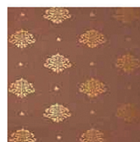
BROcado DE SEDA