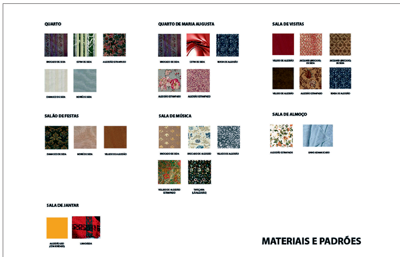
FIGURA 3. Plan de textiles para la renovación museográfica en cada una de las habitaciones, de acuerdo con la matriz cromática y los patrones/ materiales que los caracteriza.