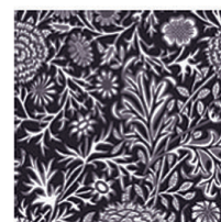
VELUDO DE ALGODÃO