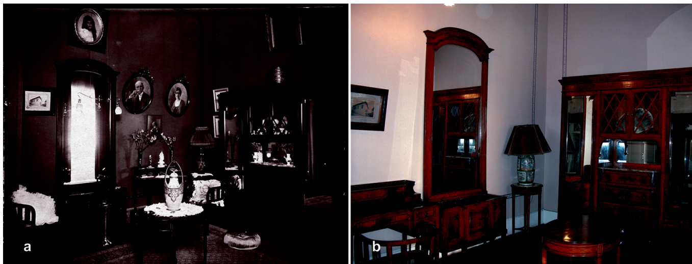
FIGURA 1. Registros fotográficos del cuarto de vestir de doña Maria Augusta: 1923 a) y 2010 b), con el fin de comparar la desaparición de elementos decorativos textiles (Cortesía: a) Acervo Fundación Casa de Rui Barbosa; b) Fotografía: Luz Neira, 2012).

no corresponde con la decoración típica de fines del siglo XIX, lo que demuestra, como ya criticó John Ruskin (1989 [1849]), que las restauraciones están sujetas a la proyección del gusto contemporáneo por encima de los periodos históricos precedentes. Una evaluación sobre su estado actual indica, entonces, un gran empobrecimiento de los espacios, tanto en virtud del desgaste de los textiles originales como debido al reemplazo de algunos de los remanentes por tipologías que no caracterizan el periodo.