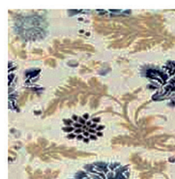
BROcado DE ALGODÃO