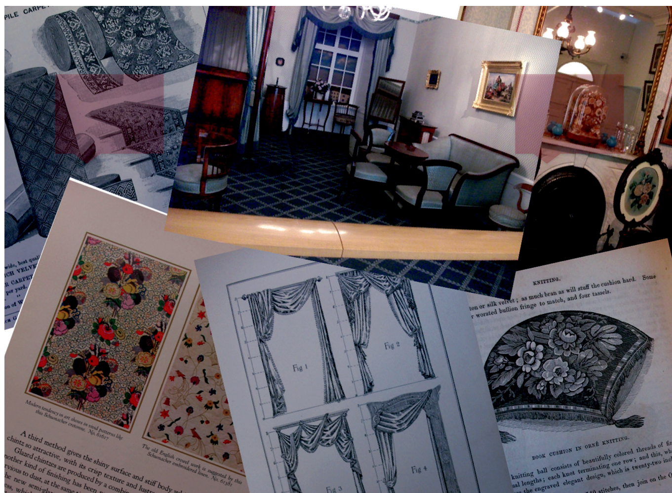
FIGURA 2. Composición visual de recursos para la investigación.

El concepto esgrimido, finalmente, sabe que el desafío no es el de (re)decorar una casa, sino desarrollar un proyecto museográfico, lo que supone elegir soluciones que mejoren el desempeño de la visita. Para alcanzar tal meta, el PRM-MCRB se ha guiado por la definición del Consejo Internacional de Museos (por sus siglas en inglés, ICOM) que asume la museografía como el arte o la técnica de las exhibiciones cuyo objeto es hacer que el público entienda los mensajes de las colecciones y exhibiciones; es decir, es una intermediaria entre la investigación y el conocimiento desarrollado en el museo y su público (Festa 2011:73).