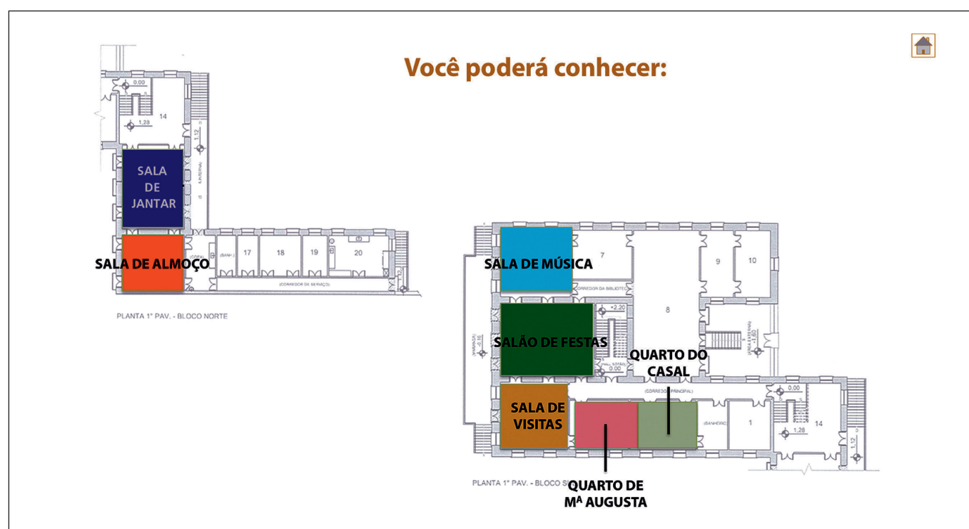
FIGURA 4. Propuesta del plan de visita a partir de la planta de la Casa de Rui Barbosa, con la caracterización funcional y determinaciones museográficas.