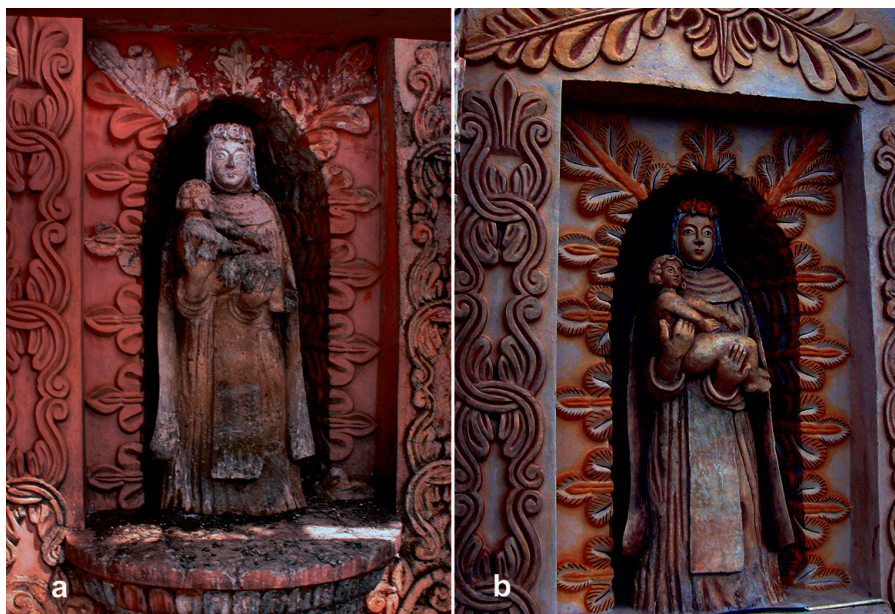
FIGURA 5. Santa Rosa de Lima antes (a) y después (b) de la restauración (Fotografías: a) María Elena Fernández Santoyo, b) Haydeé Orea; fuente: Orea Magaña y Fernández Santoyo 2006).

la información obtenida en la primera y la segunda. De este modo, se retiraron las escamas de la última y la antepenúltima capas de pintura, si y sólo si, se encontraban semidesprendidas, ya que, estimamos, el tiempo que hubiésemos tenido que dedicar a su fijado era excesivo y no contábamos con él.