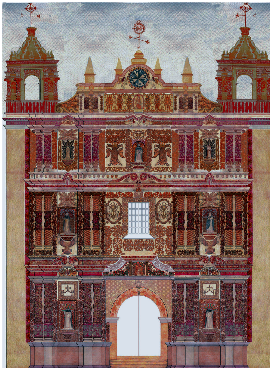
FIGURA 4. Propuesta de color para la fachada con base en la información obtenida de las capas pictóricas uno y dos, observada en las calas estratigráficas (Dibujo: Jorge B. Hernández Aguilar y J. Constantino Armendáriz Ballesteros).

Dicha capa ofrece, tanto estética como históricamente, valiosa información: da a conocer los cambios de color y tono que el elemento decorativo sufrió dados los nuevos estilos o modas imperantes en épocas posteriores (siglo XIX) a la realización de la primera policromía, y, aunque no se encontró presente en todas las áreas,