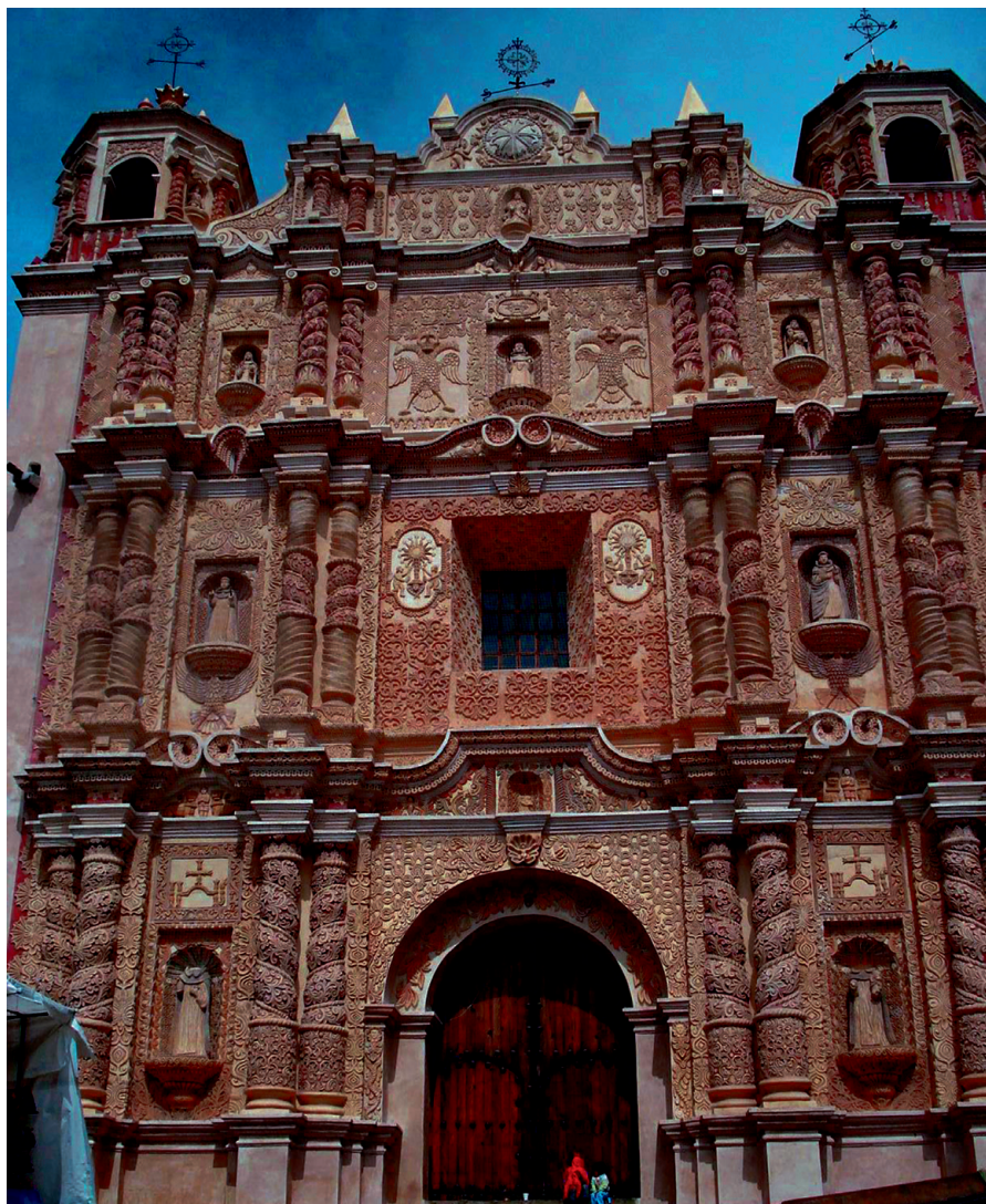
FIGURA 2. Fachada de Santo Domingo después de su restauración.

base de preparación para la aplicación de la primera policromía. Ésta empleó pigmentos terrosos principalmente para lograr su esquema pictórico, cuyo fin consistió en realzar los relieves a través de la intensificación de sombras y luces y la creación de claroscuros. Encontrar tal riqueza pictórica fue un suceso del todo inesperado para los restauradores y, mayormente, para los historiadores y arquitectos que han descrito esta portada en proyectos, informes y diversas publicaciones. 4