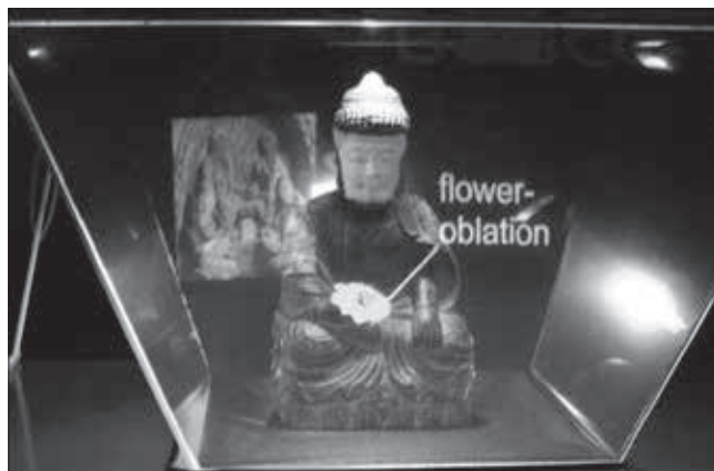
FIGURA 4. Virtual Showcase : imagen de una pequeña escultura aumentada con los gráficos 3D generados por ordenador (Fuente: Bimber 2001: 51).

También tuvo lugar otra experiencia que se basaba en esta misma aplicación, pero en este caso adaptada para dispositivos UMPC, que permiten, frente a la pantalla fija anterior, una mayor libertad de movimiento del visitante de un museo. Para su desarrollo se eligió el yacimiento de Satricum, situado al sur de Roma, que tenía una acrópolis en la que se había sucedido la construcción de tres templos en diferentes épocas de la historia de Roma. En la aplicación se recuperaba una imagen virtual del templo primitivo del siglo X a.C., además de diferentes puntos de