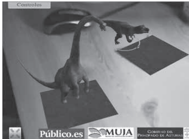
FIGURA 3. Imagen que representa la aplicación de AR online del MUJA (España), en la que puede observarse un Diplodocus y un Tyrannosaurus rex , paseando por la superficie de una mesa de ordenador.

tural History Museum de Londres (Reino Unido) ha desarrollado una aplicación online accesible desde la página web del propio museo en la que es posible interactuar tanto con un modelo virtual de la especie Homo neanderthalensis , 3 observando su fisionomía y forma de caminar, como con otro más que se corresponde con la reconstrucción de un espécimen del Australopithecus afarensis a través de los restos de un ejemplar bautizado con el nombre de Lucy ; con ambos modelos se compara la evolución de estas especies ancestrales del ser humano mediante su reconstrucción virtual basada en los estudios paleoantropológicos.