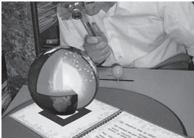
FIGURA 1. Instalación AR Volcano Kiosk, donde aparecen los modelos virtuales con una sección del interior de la Tierra.