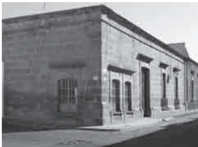
FIGURA 2. Patrimonio tradicional. Vivienda ubicada en la calle Corregidora, esquina con Rayón.

calidad arquitectónica y magnitud; todos ellos son de propiedad pública, y su estado de conservación es óptimo en la gran mayoría de los casos.