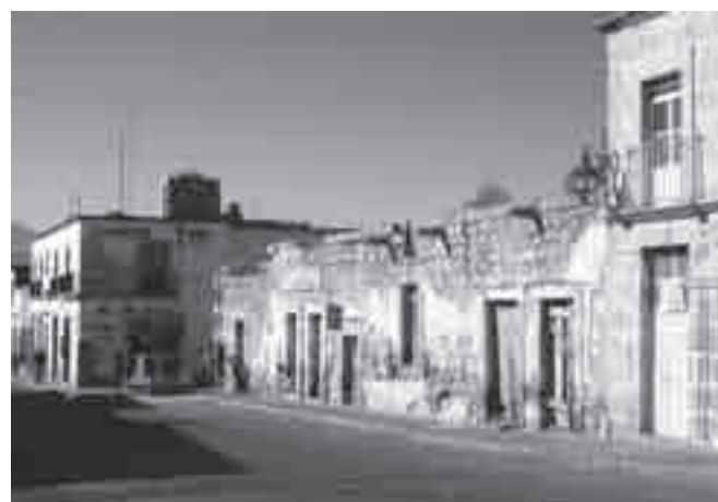
FIGURA 5. Patrimonio edificado en mal estado de conservación. Calle Vicente Santa María. (Fotografía Eugenio Mercado López, 2011).