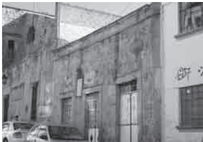
FIGURA 3. Patrimonio edificado popular, ubicado en la calle Matamoros, núm. 63.

lar, al adecuarse para aquellos especializados vinculados al turismo y la cultura—, con lo que se generan recursos económicos para su mantenimiento, resultando beneficiados en el proceso.