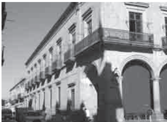
FIGURA 1. Patrimonio edificado relevante, ubicado en el Portal Matamoros, esquina con Allende.

El patrimonio edificado monumental incluye 34 inmuebles, originalmente de uso religioso y administrativo; sobresalen del conjunto por sus antecedentes históricos,