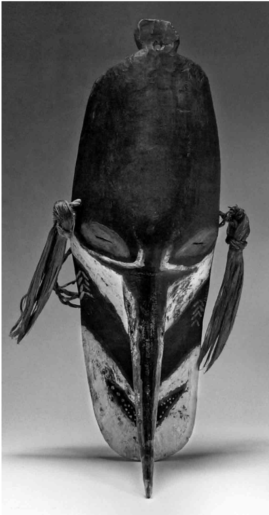
FIGURA 2. Máscara Espíritu, Isla de Mushu, Provincia del Sepik Oriental, Papúa Nueva Guinea Exposición Moana. Culturas de las islas del Pacífico (Colección Museo Nacional de las Culturas, INAH).

funcionaron como una coherente estrategia mercadotécnica, al ser reproducidos en varios tipos de souvenirs –llaveros, cuaderno de notas, etcétera– que están a la venta en la tienda de la exposición.