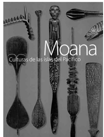
FIGURA 3. Portada del Catálogo de la Exposición Moana. Culturas de las islas del Pacífico (Cortesía INAH).

Dado que la exposición Moana forma un conjunto de piezas con calidad excepcional a nivel interna-