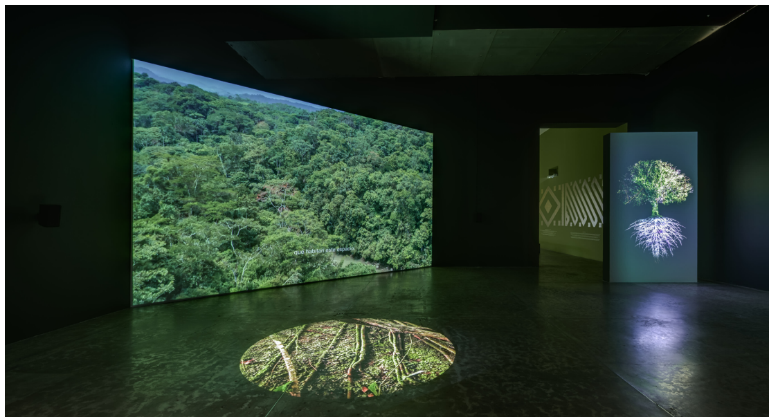
FIGURA 6. Ursula Biemann. Devenir Tierra , vistas de exposición Mente forestal , 2024.

Mediante procesos científicos de síntesis sobre el ADN de una semilla proveniente del Amazonas, la artista encuentra una codificación de elementos lumínicos que se encuentran en toda materia viva, y que, sugiere, pueden ser vistos por chamanes bajo los efectos de una planta psicoactiva. De ahí que se ponga de manifiesto una interconectividad que se alimenta con todos los seres que habitan el bosque.