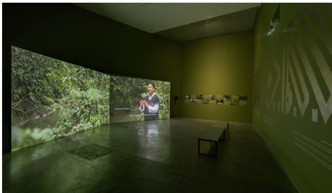
FIGURA 7. Ursula Biemann. Devenir Tierra, vistas de Mente forestal , 2024.

Sobre la propuesta museográfica, la exposición se transita a través de espacios oscuros en los que destacan las video-proyecciones que conforman las instalaciones, hay algunos núcleos temáticos que utilizan una oscuridad matizada con tonos provenientes del tema de cada instalación. Por ejemplo, en la instalación Acoustic Ocean ( Océano Acústico , 2018) prepondera el azul índigo, por lo que los muros de su espacio son de un azul índigo más oscuro y se conforma un espacio inmersivo que envuelve la mirada y provoca una participación mayor de expectación.