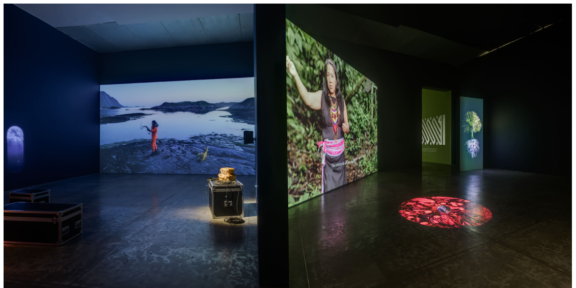
FIGURA 5. Ursula Biemann. Devenir Tierra , vistas de Océano acústico y Mente forestal , 2024.

En la siguiente sala aparece el tercer eje: “La escucha del mundo” con la obra Acoustic Ocean (Océano acústico, 2018) (Figura 5), videoperformance en el que el personaje de una bióloga marina de origen sami 2 investiga la vida submarina de las islas Lofoten, Noruega. Mediante la captura de sonidos imperceptibles al oído humano, hace un registro sonoro de los seres vivos que pueden habitar las profundidades oceánicas. En el espacio expositivo hay una ambientación con algunos objetos que formaron parte del performance , desde el traje de neopreno que portó la científica, hasta las maletas del equipo que utilizó para el registro sonoro; incluso se proyectó una especie de claraboya de submarino que simula la inmersión del espacio de esta instalación.