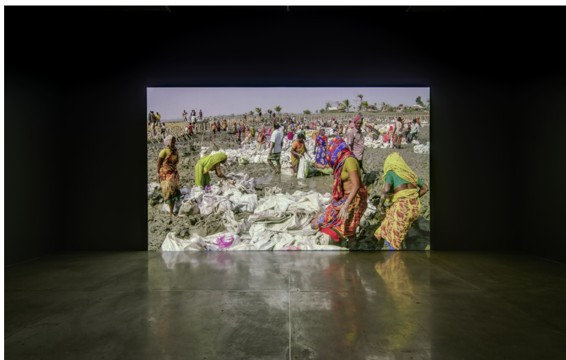
FIGURA 4. Ursula Biemann. Devenir Tierra , vistas del video Tiempo profundo , 2024.

Cabe mencionar que, el espacio museográfico parece comprimirse por la cercanía entre la pantalla de la proyección y la banca donde los públicos se sientan a observar. Esto produce una sensación de invasión, como si ese mar que se expande pronto fuera a salir de la proyección, y a desbordarse hacia la o el visitante.