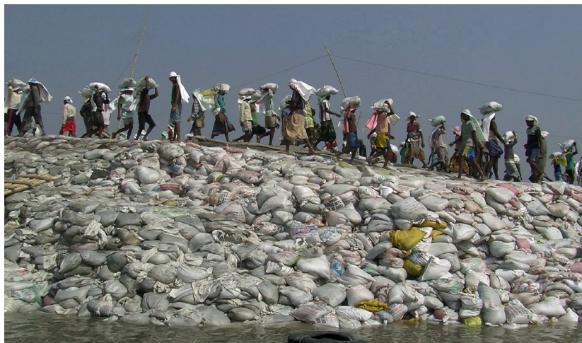
FIGURA 3. Tiempo profundo , fotograma, 2013.

Cabe mencionar que, el espacio museográfico parece comprimirse por la cercanía entre la pantalla de la proyección y la banca donde los públicos se sientan a observar. Esto produce una sensación de invasión, como si ese mar que se expande pronto fuera a salir de la proyección, y a desbordarse hacia la o el visitante.