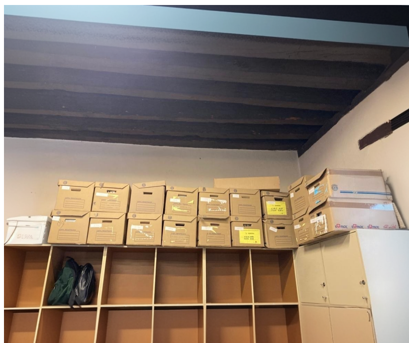
Figura 1. Cajas colocadas en el área de paquetería del Museo.

Actualmente el Archivo cumple con las tres obligaciones que comprende un archivo documental institucional, desde el corto, con el archivo de trámite, y mediano plazo, con el de concentración, hasta lo permanente, con el histórico. 1 También desarrolla actividades que coadyuvan con la conservación y difusión del Fondo Conventual Churubusco (FCCH) y de un par de remesas que se configuraron tras recuperar en el Museo documentación dispersa sin ningún tipo de cuidado o atención, tal como se observa en la Figura 1.