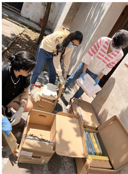
Figura 6. Estado de conservación de las cajas de documentos rescatadas en el “baño de placeres” del Exconvento, antes de recibir tratamiento

Esta remesa, si bien se había generado con el Museo, se decidió trabajarla paralelamente a la remesa uno, ya que no había responsables de la documentación y no se tenía claridad con respecto a cuál área generadora correspondía. Esa última remesa, por otra parte, recibió un tratamiento especial: el área de restauración le aplicó un procedimiento de fumigación, luego de identificar que algunos documentos tenían humedad, manchas de colores o incluso concreciones. Un ejemplo del estado en que se encontraban esas cajas se observa en la Figura 6.