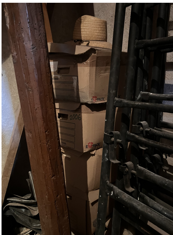
Figura 2. Cajas con documentación ubicadas en el campanario del exconvento (Fotografía: Tania Arroyo Ramírez, 2023; cortesía de la autora).

Algunas de esas cajas contenían información muy diversa concerniente a las áreas generadoras del Museo, se encontraban en un estado de conservación verdaderamente lamentable y nadie en el museo se hacía responsable de las mismas. Con esta documentación se conformó una tercera remesa de trámite y de concentración con cajas de expedientes situadas en dichas áreas y que eran consideradas, según dichos del personal, “archivo muerto”. Allí había grandes cantidades de documentos, que en el proceso de ordenamiento se trabajaron y luego incorporaron al archivo institucional.