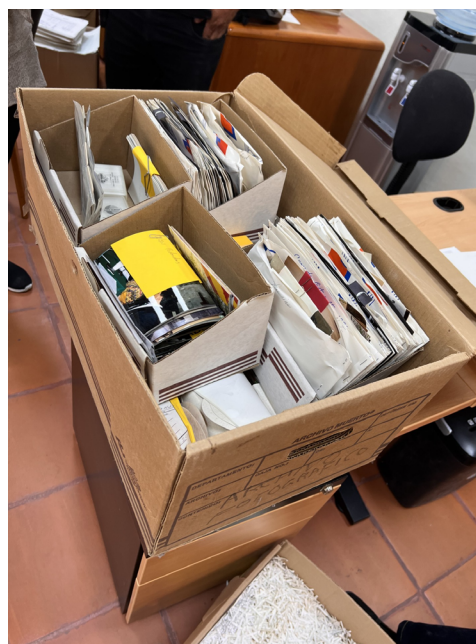
Figura 5. Se muestra el pequeño fondo fotográfico que fue recuperado junto con otras cajas con expedientes en el área de almacén del Museo

Esta remesa, si bien se había generado con el Museo, se decidió trabajarla paralelamente a la remesa uno, ya que no había responsables de la documentación y no se tenía claridad con respecto a cuál área generadora correspondía. Esa última remesa, por otra parte, recibió un tratamiento especial: el área de restauración le aplicó un procedimiento de fumigación, luego de identificar que algunos documentos tenían humedad, manchas de colores o incluso concreciones. Un ejemplo del estado en que se encontraban esas cajas se observa en la Figura 6.