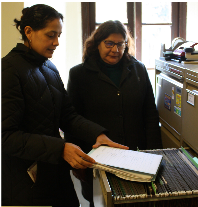
Figura 3. Capacitación impartida al personal de la Dirección del Museo (Fotografía: Tania Arroyo Ramírez, 2022; cortesía de la autora).

En cuanto a la preparación del personal, con la ayuda de la Subdirección de Archivos se estableció un programa de capacitaciones que incluyó a todas las áreas generadoras. El objetivo fue sensibilizar al equipo sobre la importancia de respetar los criterios de organización, ordenamiento y clasificación de la documentación. La Figura 3 ilustra uno de esos procesos de capacitación.