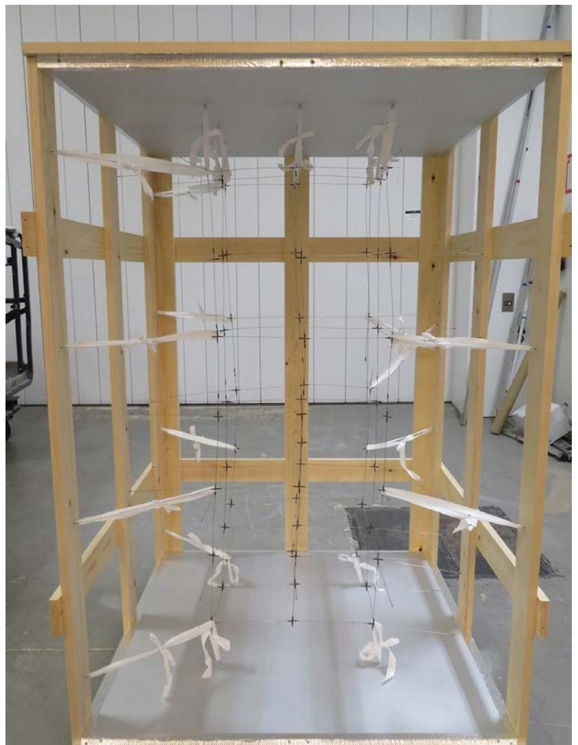
FIGURA 2. Caja de madera de Reticulárea cuadrada , elemento inferior.

Para la instalación de esa obra en la sede de destino siempre tenemos que dar instrucciones previas. En este caso, como la Reticulárea cuadrada no tiene un peso elevado, no es necesario reforzar techos para instalarla, siempre y cuando éstos ofrezcan garantías de soportar de 50 a 100 kg. En el Museo Jumex se hicieron agujeros en el techo de placa de yeso laminado y se pusieron unos ganchos (“angelitos”) para después poder pasar los hilos de náilon. Al estar sujeta al techo en cuatro puntos, la mejor opción para nivelar la obra es poner algún tipo de stopper tocando el techo, para conseguir una posición horizontal perfecta en esos puntos de sujeción (Figura 3).