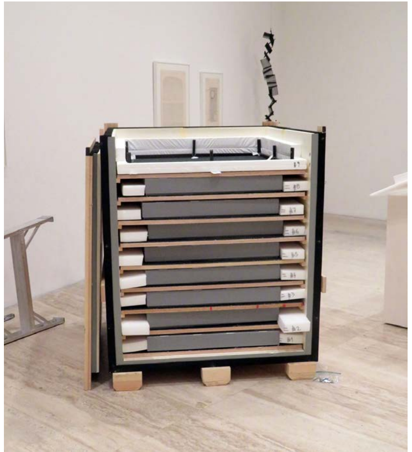
FIGURA 7. Caja de madera con las cajas de cartón de conservación.

Para concluir, sólo nos queda reafirmar que parte del trabajo de los equipos de conservación-restauración es hacer posible, desde las distintas vertientes de su profesión, que las obras se expongan, en ocasiones desde un punto de vista más conservativo y en otras, aplicando su saber en los procesos de restauración, muchas veces combinando ambas disciplinas.