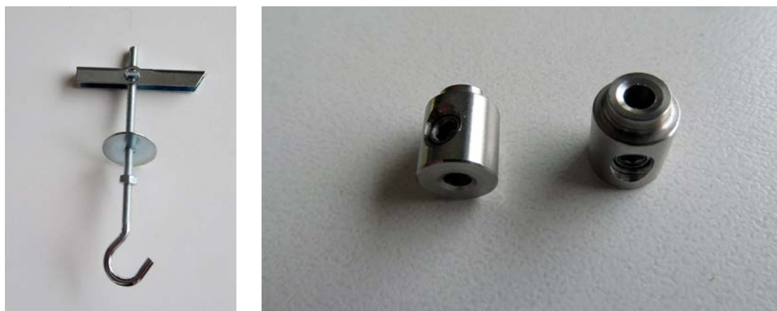
FIGURA 3. Ejemplos de gancho y stopper (Fotografía: Alejandro Castro, 2023; cortesía: MACBA).

Si bien es importante seguir las indicaciones previas en cuanto a los puntos seguros de sujeción de esas obras en el techo o pared, la dificultad en su instalación viene dada por su manipulación. Así pues, en el caso de la instalación de la Reticulárea cuadrada , primero se retira la jaula de madera del interior de la caja y se acerca a su ubicación sin manipular todavía la obra. Ésta no se extrae de la jaula, sino cuando todo está preparado para poder colgarla. En nuestro caso, la jaula de transporte tiene ruedas para acercarse lo más posible al punto de sujeción sin tener que manipular la pieza.