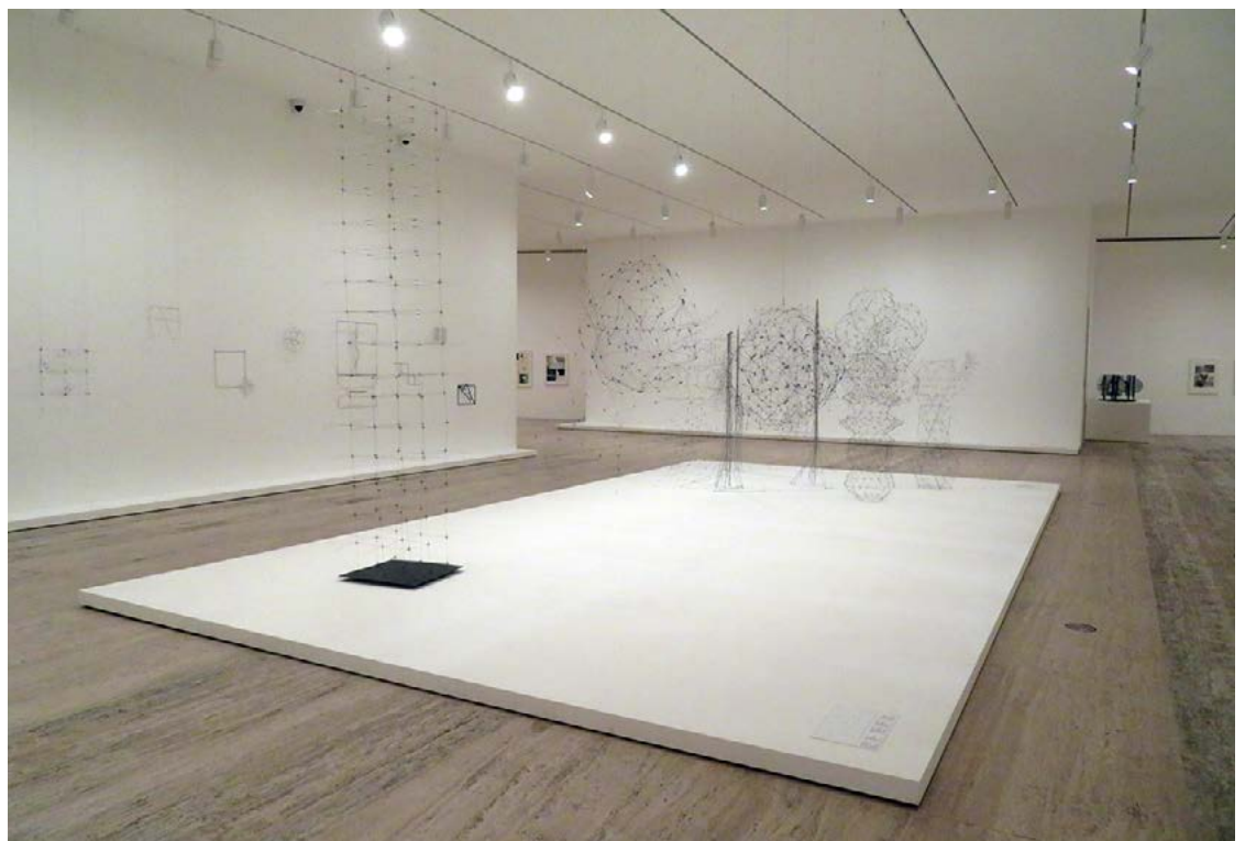
FIGURA 5. Peana central en el Museo Jumex.