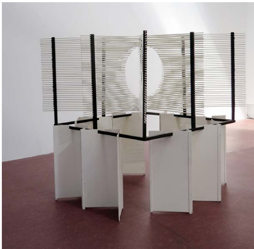
FIGURA 6. Esfera en hexaedro (Fotografía: Alejandro Castro, 2023; cortesía: MACBA).

Antes de viajar para este préstamo tuvimos que restaurar la obra, ya que había estado expuesta en un jardín y presentaba oxidación, pérdidas y suciedad. Además, era la primera vez que salía del MACBA, por lo que hubo que concebir y diseñar embalajes adecuados.