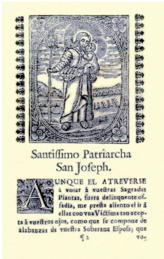
Figura 3. Señor San José, patrono contra rayos y temblores. Biblioteca Nacional-Fondo Reservado. Manuscritos 779.

María Santísima es nuestra madre, medianera, abogada para todo y especial patrona de las aguas convenientes, acaso te falta poder, autoridad, mérito o valimiento con tu hijo Dios