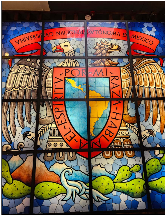
Figura 1. Reproducción del Vitral del Escudo Universitario, ca. 1920, Jorge Enciso y Enrique Villaseñor. Instalado en el plafón de la entrada del Museo UNAM Hoy , original en el Templo de San Pedro y San Pablo.

innovación urbana. Si bien la exposición podía haberse planteado como un recorrido cronológico, su organización fue más ambiciosa al brindar al visitante dos perspectivas de análisis, desde un plano institucional y desde el amor a la ciudad.