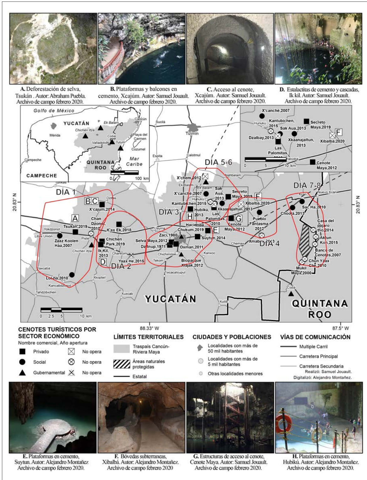
Figura 3. Modificaciones estructurales en los cenotes del traspais yucateco de Cancún-Riviera Maya.