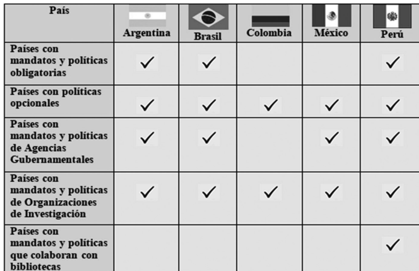
Figura 3. Resultados del análisis de normatividades de acceso abierto de Latinoamérica

Los resultados generales del análisis de contenido de las normatividades de acceso abierto en Latinoamérica se presentan comparativamente en la Figura 3 .