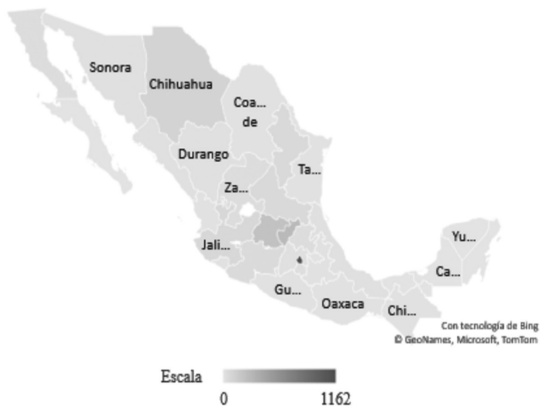
Figura 6. Distribución de la producción de la UAQ a nivel nacional en WoS: 2010-2020 Fuente: Elaboración propia con base en datos de W