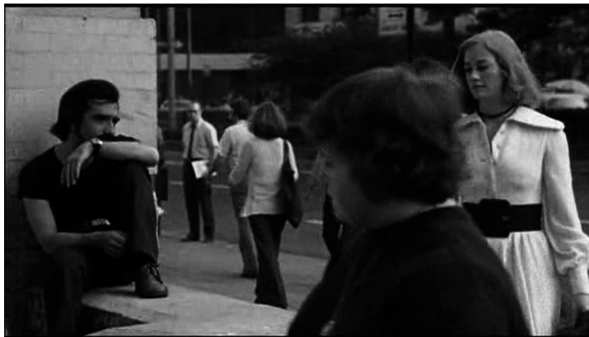
Figura 6. "La vi por primera vez..."

Frente a la masa informe, el relato hace emerger a Betsy. Aquí Scorsese recrea el guion de Schrader con una puesta en escena diferente. En vez de estar sentada en las oficinas (en el guion), Betsy aparece caminando en cámara lenta mientras entra en esas oficinas. Esta opción estilística de Scorsese aumenta el efecto de fascinación cuando es el propio Scorsese el que sale en el plano en el que vemos por primera vez a Betsy, además de optar por la ralentización de la imagen. Frente a la masa indistinguible de la calle, se erige la figura de Betsy (Figura 6). Justo antes de esa aparición, Scorsese también opta por planos de día para representar a la masa, pero siguiendo la lógica de la distorsión de la mirada de Travis, el director escoge un gran angular con steady cam , produciendo una impresión de extrañeza.