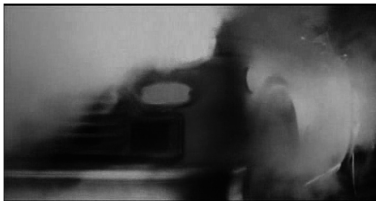
Figura 1. Fotograma del taxi

Scorsese tradujo visualmente la metáfora de Schrader (2018) cuando éste imaginó el germen de su guion como un ataúd de hierro surcando la ciudad ( Figura 1 ).