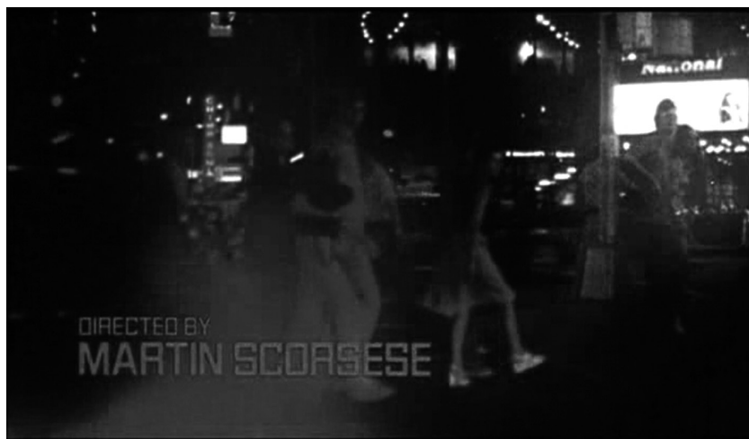
Figura 3. "Una oscura sombra..."