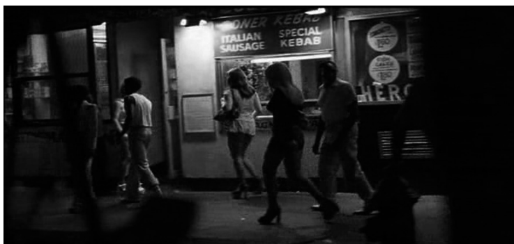
Figura 5. “Por la noche salen bichos de todas clases...”

Schrader sigue la técnica de comunicar al personaje desde dentro hacia afuera, tal como prescribiría Stanislavski (1975), tanto con su flujo de pensamiento como con su percepción.