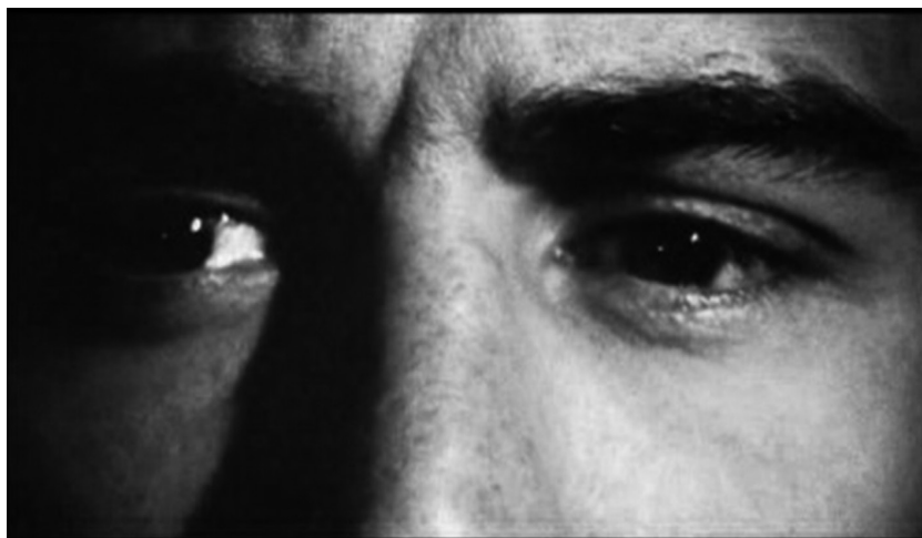
Figura 2. “Detrás de esa sonrisa...”

Frente a esas descripciones objetivas localizamos en esa acotación la descripción de estados mentales que sólo pueden ser leídos a través de la observación de la conducta externa. Por ejemplo, cuando el guion señala lo siguiente ( https://www.dailyscript.com/scripts/taxidriver.html , cursivas nuestras): “Detrás de esa sonrisa, tras sus oscuros ojos, en sus mejillas demacradas, podemos ver las manchas ominosas causadas por una vida de miedo íntimo, de vacío, de soledad”. El director traduce esa descripción en una serie de planos de la mirada de Travis a su espejo retrovisor ( Figura 2 ).