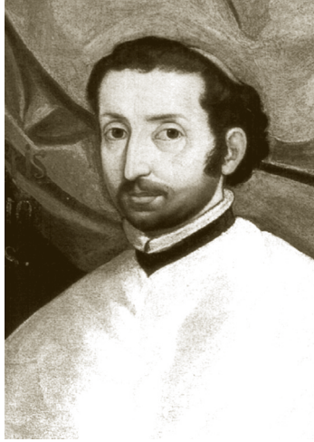
JUAN DE PALAFOX Y MENDOZA

Don Juan sin duda estuvo al tanto del desarrollo de las bibliotecas de su época puesto que estuvo relacionado con la corte, uno de los espacios en que las bibliotecas eran muy importantes.