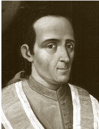
Francisco Fabián y Fuero

La biblioteca se fue enriqueciendo con las donaciones hechas por los sucesores de Palafox como Manuel Fernández de Santa Cruz y de manera muy sobresaliente por el interés y el entusiasmo de don Francisco Fabián y Fuero, nombrado obispo de Puebla por Carlos III en 1765.