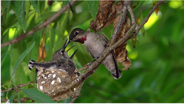
Figura 2. Hembra de colibrí de cabeza roja alimentando a dos polluelos en su nido. Fotografía tomada el 13 de octubre de 2016 en el Parque Victoria de Lerdo, Durango