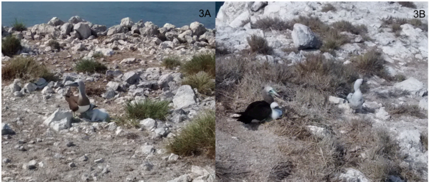
Figura 3. (A) Adulto macho y pollo de 3 semanas de Sula leucogaster anidando en la planicie del islote Hermano Sur (13 de mayo de 2015). (B) Adulto macho y pollo de 3-4 semanas (lado izquierdo de la foto) descansando en el nido y pollo de 5 semanas en las cercanías del nido (lado derecho de la foto) en la cara suroeste del mismo islote (13 de mayo de 2015).