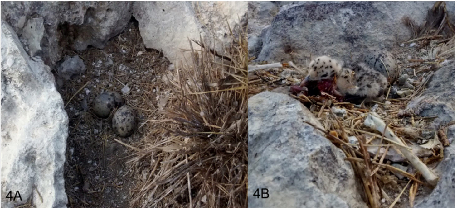
Figura 4. (A) Nido de Larus heermanni con tres huevos en la planicie del islote Hermano Sur. (B) Pollo de aproximadamente 1 semana y un huevo en nido de Larus heermanni en la zona noroeste del islote (13 de mayo de 2015).

también se han detectado nidos en los islotes El Negro y Cerrios Blancos en la bahía de Navachiste (Guevara-Medina datos no publicados).