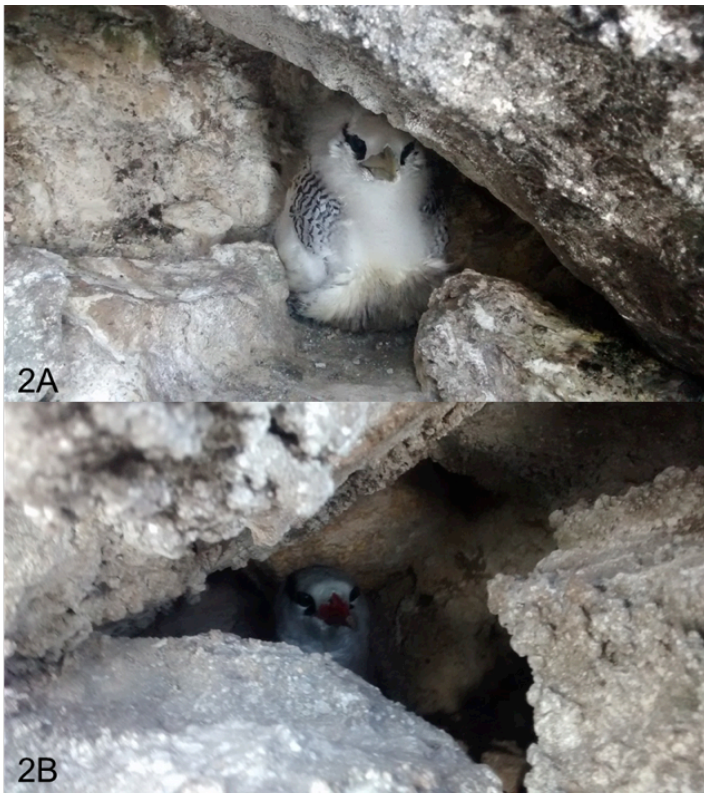
Figura 2. (A) Pollo de Phaethon aethereus de aproximadamente 4-5 semanas en un nido (13 de mayo de 2015) y (B) adulto de P. aethereus con pollo de aproximadamente 2-3 semanas en una cavidad (13 de mayo de 2015). Ambos nidos fueron registrados en la cara norte del islote Hermano Sur.

Registramos al bobo café en los islotes Hermano Norte y Hermano Sur durante todos los recorridos que realizamos. El número máximo de individuos fue de 211 en 2004 y de 89 en 2015. En mayo de 2015, en la cima del Hermano Sur, registramos tres nidos activos con pollos de aproximadamente tres, cinco y siete semanas de edad (Figura 3A y 3B). La ausencia de huevos y la etapa de desarrollo de los pollos indican que la puesta de huevos ocurrió entre los meses de febrero-marzo, lo cual es diferente a la temporalidad observada en otras colonias del golfo de California (tres meses de retraso aproximado; Mellink 2000). Sin embargo, 2015 fue un año con presencia del fenómeno El Niño Oscilación del Sur y esto alteró la reproducción de las aves marinas en la región (Mellink 2000, Castillo-Guerrero et al. 2011). Al igual que el rabijunco pico rojo, es el primer registro de reproducción reportado para la especie en las islas en la bahía de Mazatlán, y junto con el Farallón de San Ignacio (González-Bernal et al. 2002, Guevara-Medina et al. 2008) son los únicos sitios donde se ha registrado su reproducción en Sinaloa.