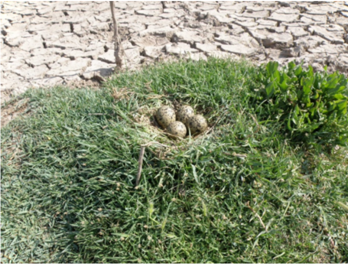
Figura 2. Uno de los nidos de la avoceta americana sobre zacates.

considerable y que la cantidad de basura se incrementaba de una visita a otra; estos y otros factores influyen en la calidad del hábitat para los miembros de la familia Recurvirostridae, así como de las otras aves terrestres que se reproducen en el área. El agua que llega a los ríos y lagunas usadas para anidar y para alimentación está contaminada y es necesario que se analice.