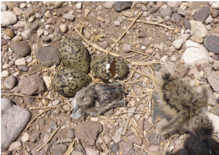
Figura 3. Pollos de avoceta americana.

Tomando en cuenta las características de los lugares donde vimos los nidos, incluimos las zonas potenciales de anidación en el mapa de la figura 1, donde se podrían realizar estudios en el futuro. Estas zonas tienen cuerpos de agua, vegetación escasa y áreas pedregosas. Debido a que la selección del área de anidación varía de acuerdo con los patrones de precipitación y la disponibilidad de cuerpos de agua efímeros (Dechant et al. 2002), los lugares específicos de anidación y la cantidad de avocetas presentes seguramente variará de un año a otro.