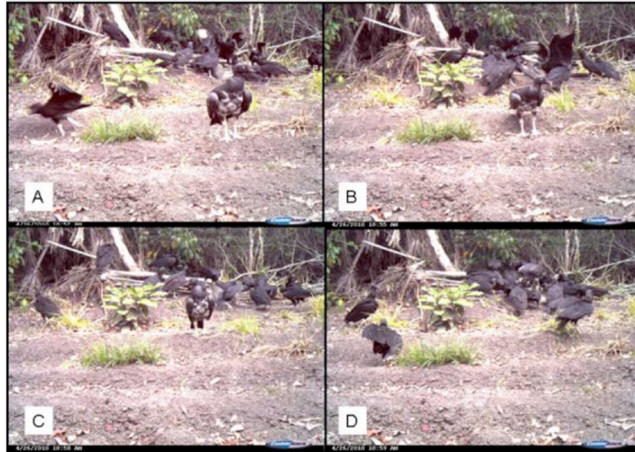
Figura 2. Serie fotográfica en la que se observa un zopilote rey juvenil, así como zopilotes de cabeza negra alimentándose de un pecarí de collar muerto en la región de la Selva La Montaña, Campeche, México.

fue cercano a una brecha rodeada de selva baja inundable y un acahual en recuperación. La fotografía, tomada a las 13:00 h, muestra a un zopilote rey perchado sobre un tronco (Figura 3). El individuo fotografiado corresponde a un juvenil de 1 a 2 años (Clinton-Eitniew 1996), reconocible como zopilote rey por las características faciales y del pico.