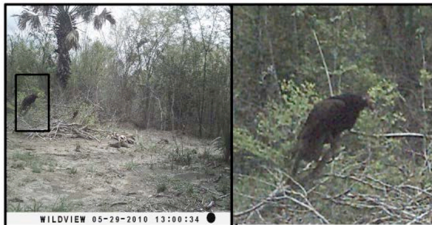
Figura 3. Fotografía de un zopilote rey juvenil perchado en la región de la Selva La Montaña, Campeche, México. Se muestra la fotografía original y ampliación para mostrar las características del zopilote rey.