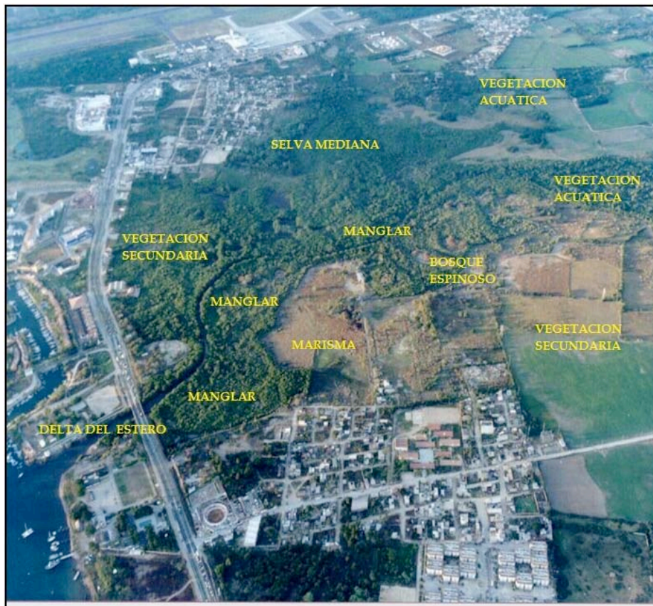
Figura 1. Unidades de muestreo (tipos de vegetación) en el Área Natural Protegida Zona de Conservación Ecológica Estero El Salado, Puerto Vallarta, Jalisco, México.

representaron los diferentes tipos de vegetación seleccionados: bosque de manglar, selva mediana subcaducifolia, bosque espinoso, marismas, vegetación secundaria e inducida, vegetación acuática y ribereña, y la porción del delta del estero. Estos tipos de vegetación los delimitamos con un GPS en campo (Figura 1). Llevamos a cabo un inventario estratificado e intensivo que consistió en salidas de búsqueda sin limitantes en cuanto al número de registros en cada una de las unidades de muestreo, durante 30 min (Villaseñor-Gómez y Santana 2003). Realizamos modificaciones en cuanto al conteo en trayecto, debido a que algunas unidades de muestreo no fueron suficientemente extensas. Cada trayecto tuvo una longitud de 500 m por 100 m de ancho que recorrimos en 30 min, excepto en la unidad del bosque de manglar, donde el trayecto recorrido fue de 2,000 m en 60 min con un ancho de 50 m, y en el delta del estero, donde sólo realizamos un registro de aves durante 15 min debido a su menor tamaño (Emlen 1971). Para los avistamientos e identificación de las aves utilizamos binoculares (10x50 y 7x35) y guías de identificación de aves (Sibley 2003, Howell y Webb 2005, Dunn y Alderfer 2006).