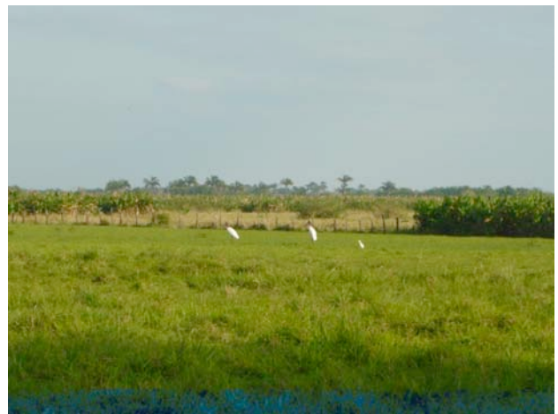
Figura 1. Individuos de Jabiru mycteria observados en un humedal de la cuenca baja del río Tonalá, municipio de Huimanguillo, Tabasco.

Las aves se encontraban alimentándose en el pantano y de vez en cuando se aproximaban una a la otra, pero debido a que no contábamos con binoculares no pudimos apreciar correctamente lo que ellas hacían al encontrarse muy próximas. Es probable que ambos individuos hayan sido subadultos, ya que la coloración roja del cuello no era tan intensa como la de un adulto en etapa de reproducción. Las observamos por un tiempo aproximado de 15 minutos, a una distancia aproximada de 85 m y las fotografiamos con una cámara digital Panasonic Lumix DMC IS80 8.1 megapíxeles con zoom óptico de 3x. La identificación la realizamos comparando las fotografías con la ilustración y descripción de la especie presentes en el trabajo de Peterson y Chalif (1989).