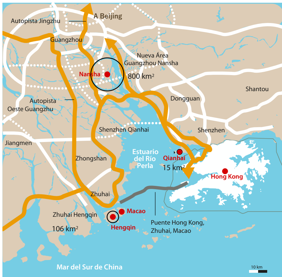
MAPA 1. Región de influencia de Hengqin con infraestructura y nuevas áreas especiales