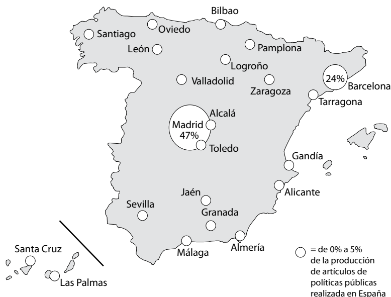
MAPA 1. Distribución geográfica de los artículos sobre análisis de políticas públicas