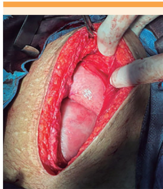
Figura 3. Múltiples adherencias al intestino, íntima relación con la cavidad debido a reintervenciones previas.