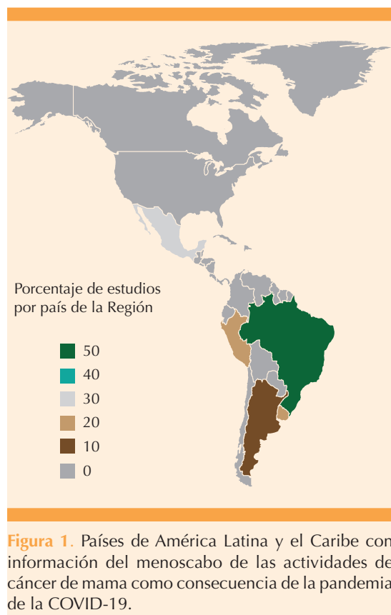
Figura 1. Países de América Latina y el Caribe con información del menoscabo de las actividades de cáncer de mama como consecuencia de la pandemia de la COVID-19.

Primero, es preciso acotar que la región de América Latina está conformada por 20 países. 19 Es interesante ver en la Figura 1 que solo en 5 de estos países se encontró información de las interrupciones del tamizaje; distribuyéndose, de la siguiente manera: Brasil (47% 8 de 17 reportes), seguido de México (23% 4 de 17 reportes), Uruguay (12% 2 de 17 reportes), Perú (12% 2 de 17 reportes) y Argentina (6% 1 de 17 reportes).