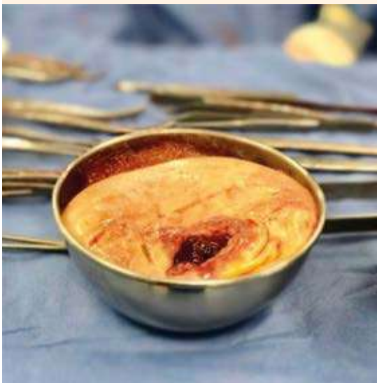
Figura 1. Tumor apendicular. Masa de tejido de aspecto quístico, con bordes engrosados de color pardo con áreas translúcidas. En el interior ocupada en su totalidad por abundante material de aspecto mucoso de color amarillo y consistencia gelatinosa.

En el reporte del procedimiento quirúrgico se asentó que la disección se hizo por planos, hasta la cavidad abdominal, en donde se encontró material mucinoso libre, mismo que se retiró, antes de la histerotomía. Enseguida se exploró el anexo derecho, con hallazgo de una masa de aproximadamente 15 cm, blanda, de contenido mucoso espeso, de bordes lisos, con solución de continuidad en la cápsula, de aproximadamente 4 cm, con drenaje de material mucinoso ( Figura 1 ). Puesto que nada anormal se encontró en la trompa y ovario derechos, se sospechó el origen intestinal. En ese momento se solicitó la intervención de un cirujano general, quien exploró la cavidad en torno del ciego y evidenció que el apéndice estaba parcialmente lisado, con fragmentos de cápsula adherida. Se procedió a la cecectomía parcial, con suturas lineales de 55 mm y refuerzo de prolene vascular. Posterior a la limpieza de la cavidad se procedió al cierre