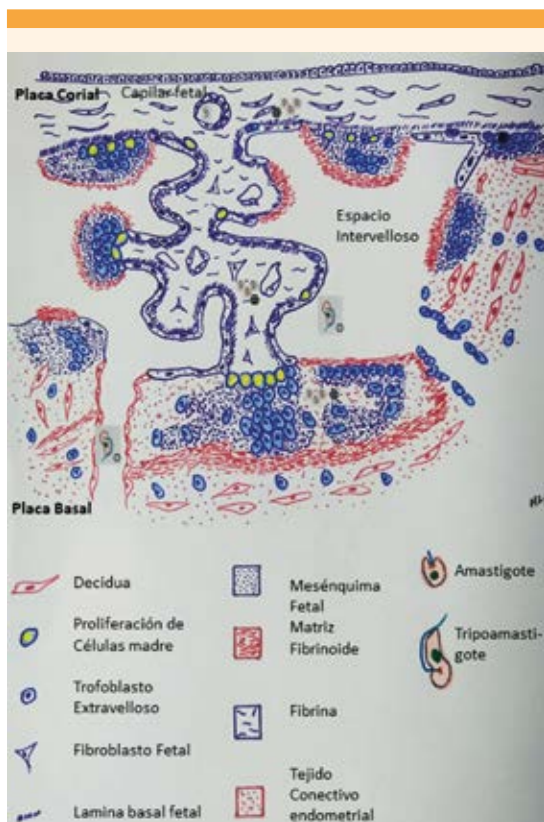
Figura 2. Mecanismo de transmisión trasplacentaria del Chagas. La forma amastigote del Trypanosoma cruzi en la sangre materna pasa al espacio intervilloso donde entra en contacto con la superficie vellositaria-trofoblasto (○). Luego de ingresar al tejido viloso se transforma en amastigotes que conforman nidos o quistes (⊗) que proliferan hasta que se lleva a cabo la invasión del torrente sanguíneo fetal a través de los capilares fetales. Imagen adaptada de la referencia 16, capítulo 8, página 110.

de los recién nacidos prematuros hijos de madres con Chagas no superviven. 13 En este caso, se trató de un prematuro extremo, con meningoencefalitis chagásica, enfermedad menos frecuente en la presentación de esta parasitemia. 11