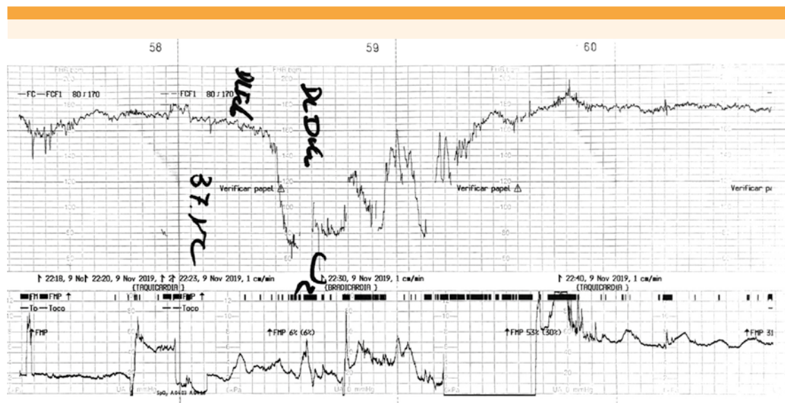
Figura 1. Registro cardiotocográfico fetal.