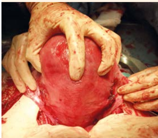
Figura 3. Aspecto de la pared uterina después de suturar el vaso sangrante.

endometriósicos, adherencias, cirugías previas, miomas uterinos y multiparidad. 3,4