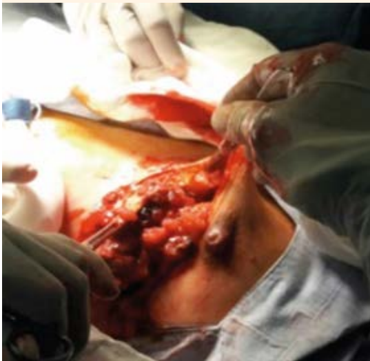
Figura 2. Mastectomía de limpieza.

droide focal. No se reportaron complicaciones posquirúrgicas y la paciente tuvo una evolución satisfactoria ( Figura 3 ).