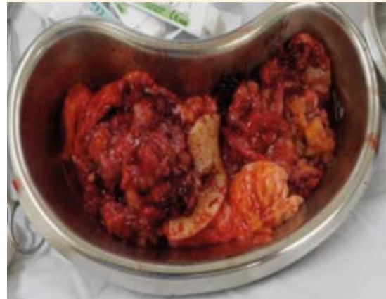
Figura 3. Pieza quirúrgica del tumor filodes.

droide focal. No se reportaron complicaciones posquirúrgicas y la paciente tuvo una evolución satisfactoria ( Figura 3 ).