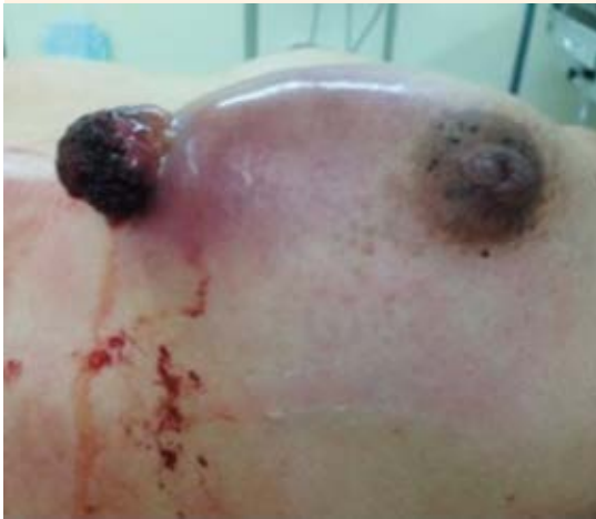
Figura 1. Glándula mamaria izquierda con protrusión del tumor en el sitio de punción de la biopsia.