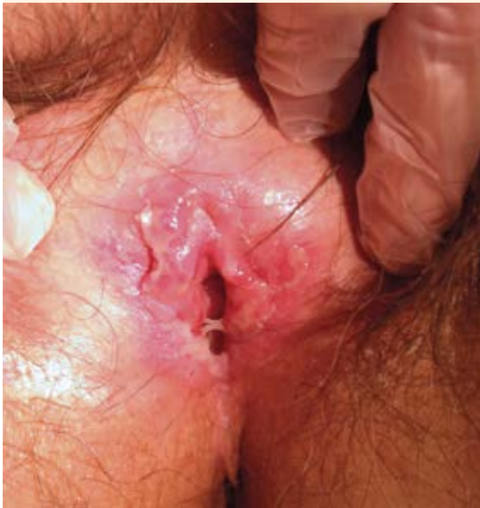
Figura 1. Imagen macroscópica de la vulva.

identificó al útero normal en anteflexión, sin masas anexiales.