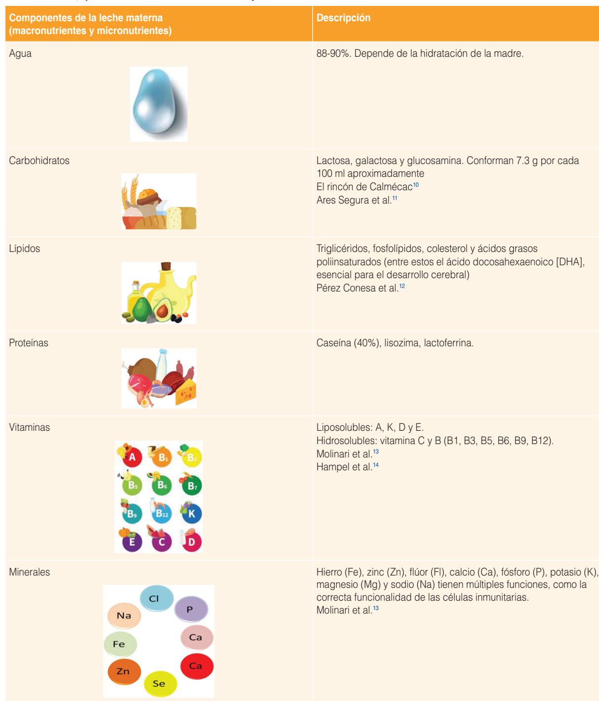
Tabla 1. Macronutrientes y micronutrientes de la leche materna. En la leche materna se encuentran componentes esenciales para que el neonato pueda crecer y desarrollarse, estos se dividen en macronutrientes, como carbohidratos, grasas (lípidos) y proteínas, y micronutrientes, que esencialmente son las vitaminas y los minerales

– Enzimas. Son un componente abundante en la leche materna. Participa en el correcto funcionamiento del sistema digestivo e inmunitario en el infante. 19