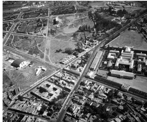
Figura 1. El ISET en construcción, 1935. Es un edificio único, en un espacio destinado a la salud. Foto disponible en línea. Original perteneciente al Fondo Aerofotográfico de ICA.

de salud de una población. El paludismo, la leishmaniasis, la oncocercosis y la enfermedad de Chagas son ejemplo de enfermedades tropicales con impacto epidemiológico en México.