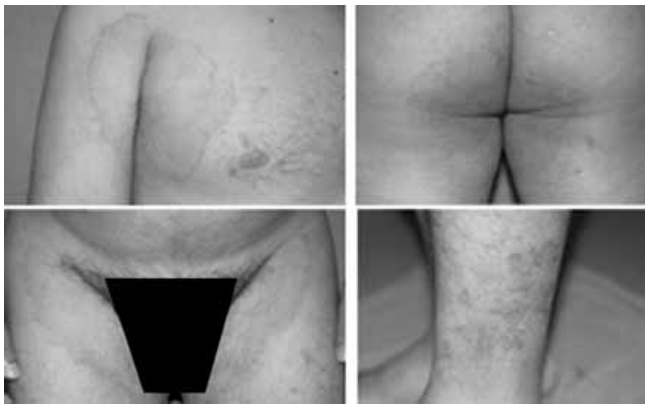
Figura 1. Placas extensas anulares eritematosas algunas con borde activo, localizadas en axilas, nalgas y piernas.

más frecuentes de exacerbación y remisión. Ha sido tratado con crema de miconazol y ketoconazol por vía oral. En los últimos 18 meses ha tomado de manera inconstante itraconazol 100mg/día o fluconazol 200mg/día, recidivando la dermatosis cuando suspende los medicamentos. Dada la pobre respuesta terapéutica, el paciente fue enviado para su estudio al Servicio de Dermatología con el diagnóstico de tiña diseminada recidivante.