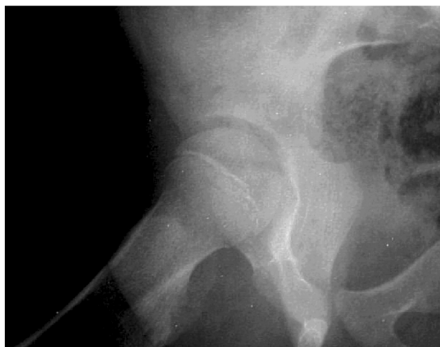
Figura 1. Placa simple de articulación de cadera derecha que muestra aumento del espacio articular, aumento de densidad en tejidos blandos y discreta desmineralización acetabular.

La mala definición de los bordes de la lesión osteolítica es el dato radiológico más típico de infección. La acumulación del líquido articular puede verse como edema de partes blandas, distensión capsular, y desplazamiento lateral leve de la epífisis osificada. Se deberá medir la distancia de la lágrima del acetábulo a la metáfisis medial de ambos cuellos femorales. La asimetría en la amplitud de los espacios intraarticulares de 1-2 milímetros sugiere derrame articular, y una asimetría mayor de 2 milímetros es patológica, sin embargo, la ausencia de asimetría no excluye un derrame articular que se demuestre con ultrasonido. 8