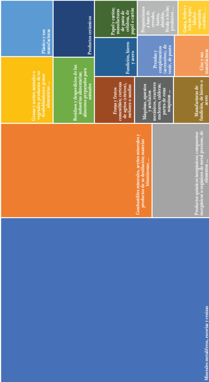
GRÁFICA 3 Principales productos de importación de Venezuela a la CAN