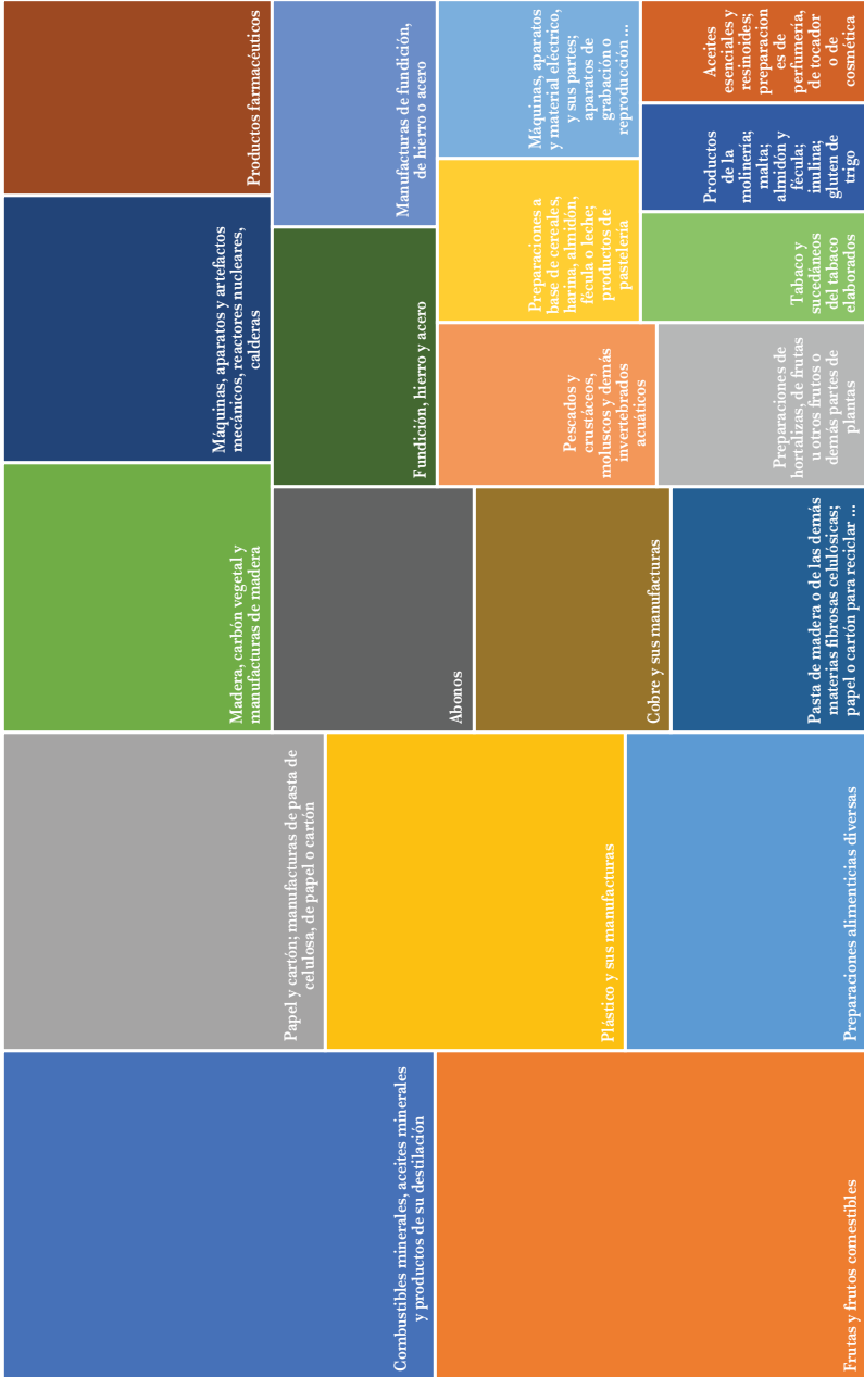
GRÁFICA 2 Principales productos de importación de Chile a la CAN