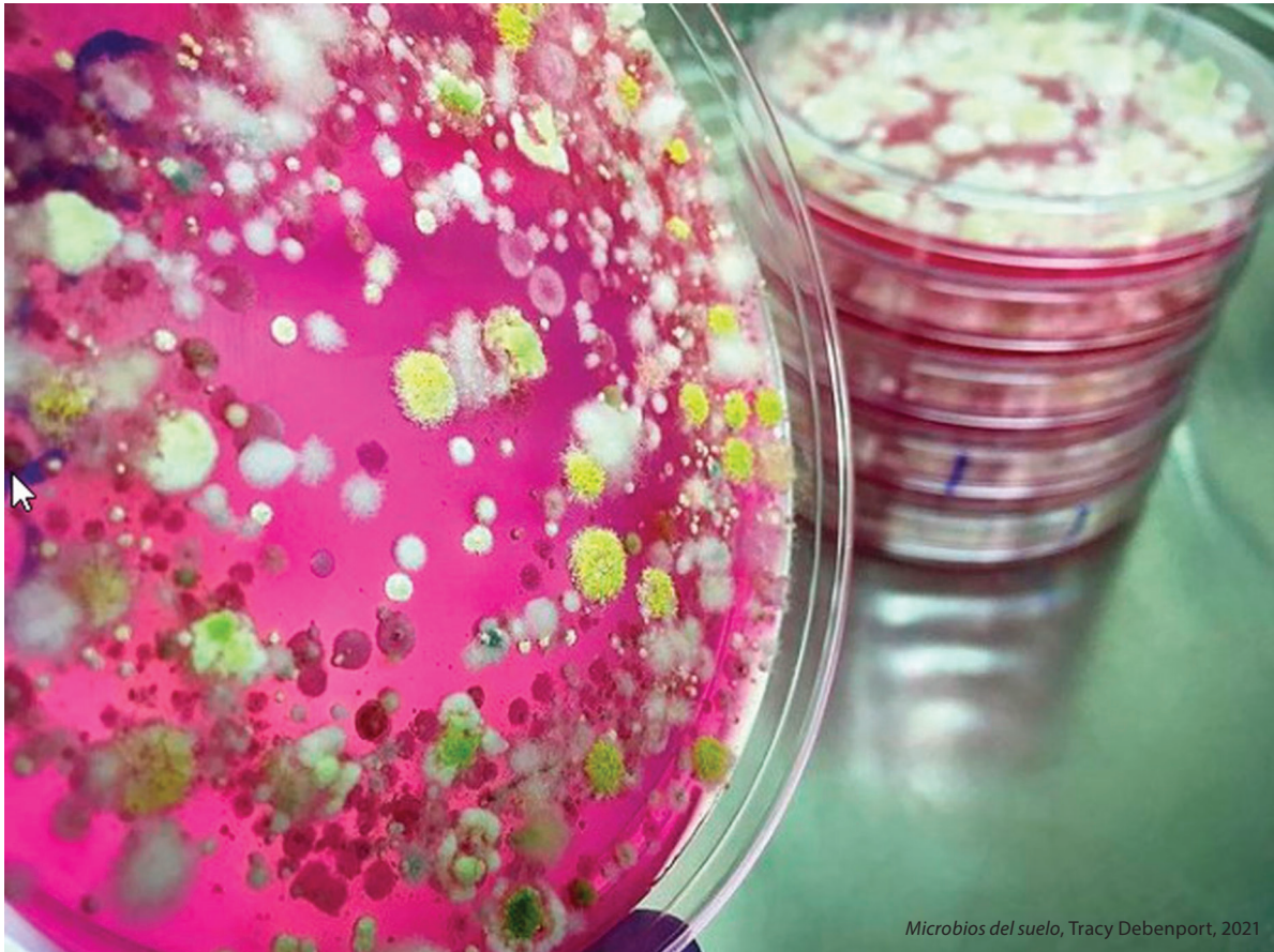
Microbios del suelo , Tracy Debenport, 2021