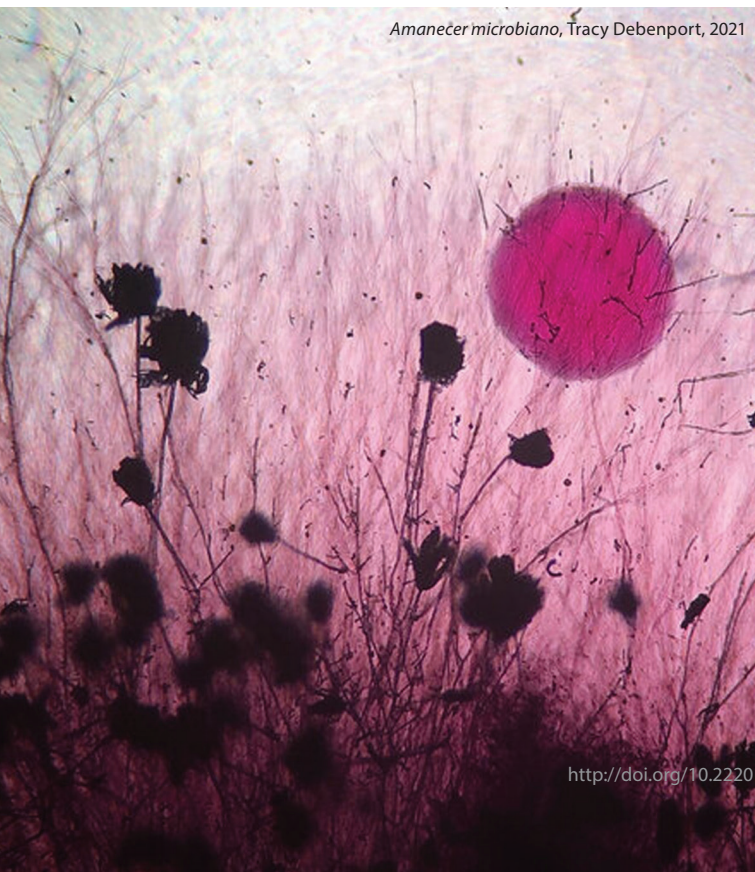
Amanecer microbiano , Tracy Debenport, 2021

semanas, para que se evaporara el alcohol, aunque el procedimiento completo podía tardar hasta tres meses. El siguiente paso era observarlas con un microscopio de altos aumentos fabricado por la empresa Bevshots, y fotografiar los campos que observaba. Las coloridas imágenes que obtuvo correspondían a los carbohidratos cristalizados. Cada imagen es una obra que identifica a cada bebida y, al mirarlas, no queda más que reconocer el toque artístico de la naturaleza, que no siempre es accesible al poder de resolución del ojo humano 6 .