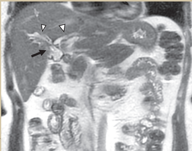
Figura 2. RM coronal T2 finos