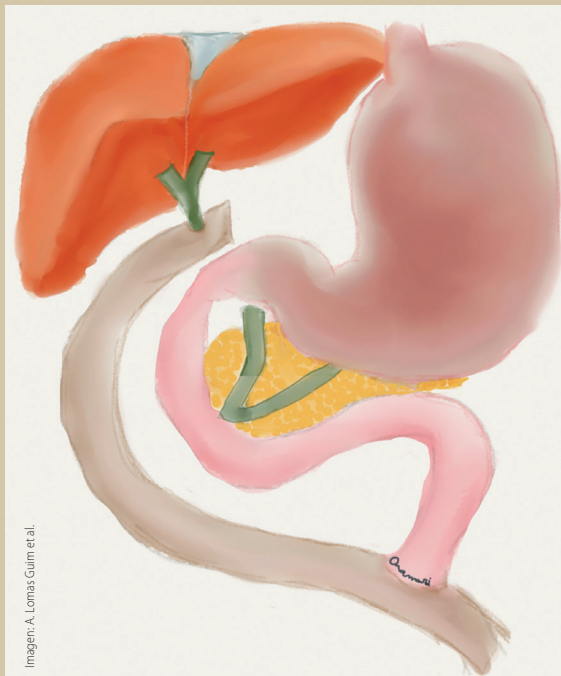
Figura 1. Esquema de anastomosis bilioentérica en Y de Roux

presentó además con náuseas y emesis de contenido bilioso en varias ocasiones.